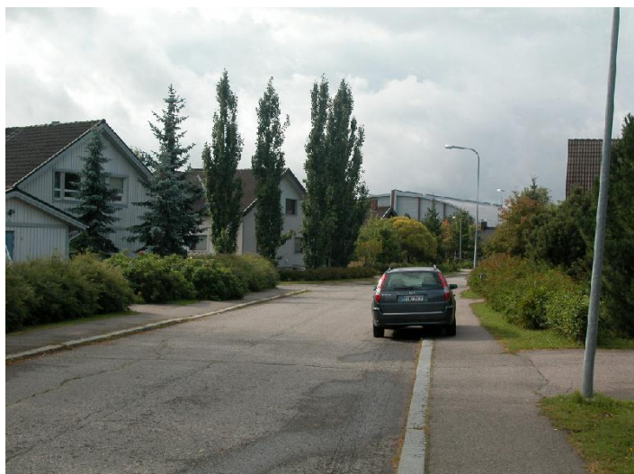
Omakotitaloja Härmälässä Pilotinkadun varrella. Taustalla Tampereen messu- ja urheilukeskuksen C-hallin päätyä. 6.9.2007.