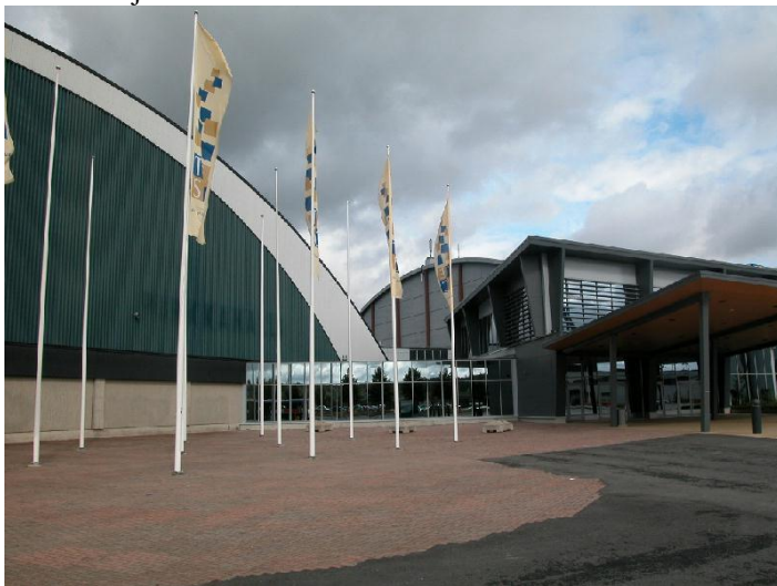
Tampereen messu- ja urheilukeskuksen pääsisäänkäynti etelästä, A- ja C-hallit sekä pääaula. 6.9.2007, Miia Hinrichsen.