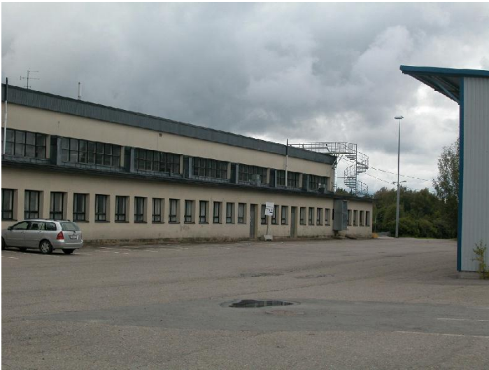
Ilmavoimien lentokonehalli, nykyinen Tampereen messu- ja urhelukeskuksen B-halli, koillissivu. 6.9.2007, Miia Hinnerichsen.