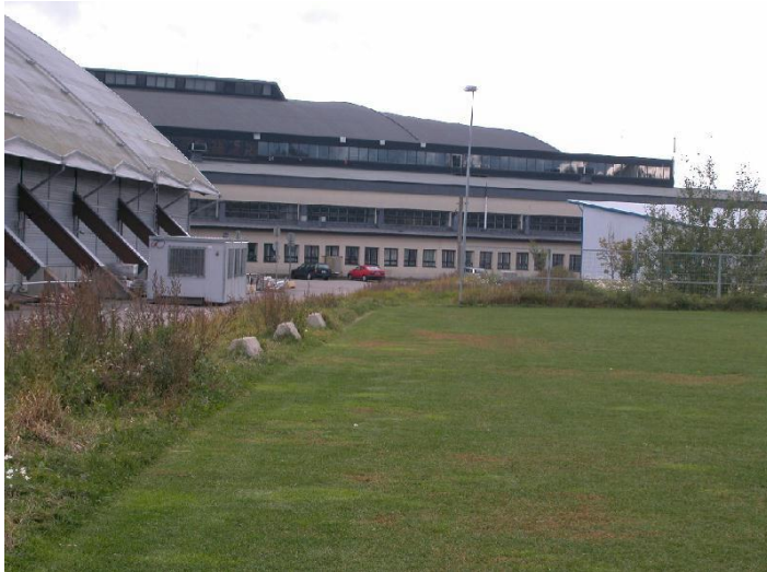
Ilmavoimien lentokonehalli, nykyinen Tampereen messu- ja urhelukeskuksen B-halli idästä. 6.9.2007, Miia Hinrichsen.

Rakennuksella on pitkä toimintahistoria. Alunperin se on Härmälän entisen lentokentän ja lentokonetehtaan toimintaan kiinteästi liittynyt entinen Ilmavoimien lentokonehalli. Rakennus on lentokentän vanhin rakennus ja ainoa säilynyt lentokonehalli, ja siksi kiinteä osa suomalaista liikenne- ja ilmailun historiaa. Rakennuksella on merkitystä myös sosiaalishistoriallisesti, sillä nykyisin halli toimii messu- ja urheiluhallina. Vuonna 1936 valmistunut halli edustaa 1930-luvun modernia, funktionalistista sotilasarkkitehtuuria, jota on säilynyt myös Suomessa ainutlaatuisella entisen lentokonetehtaan alueella. Lentokonehallin koillissivu on tehdyistä muutoksista huolimatta säilynyt kauniisti alkuperäisessä asussaan.