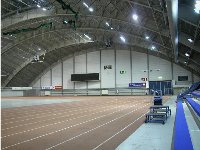
Tampereen messu- ja urheilukeskuksen A-halli eli Pirkkahalli, yleiskuva sisätilasta. 6.9.2007, Mii Hinnerichsen.