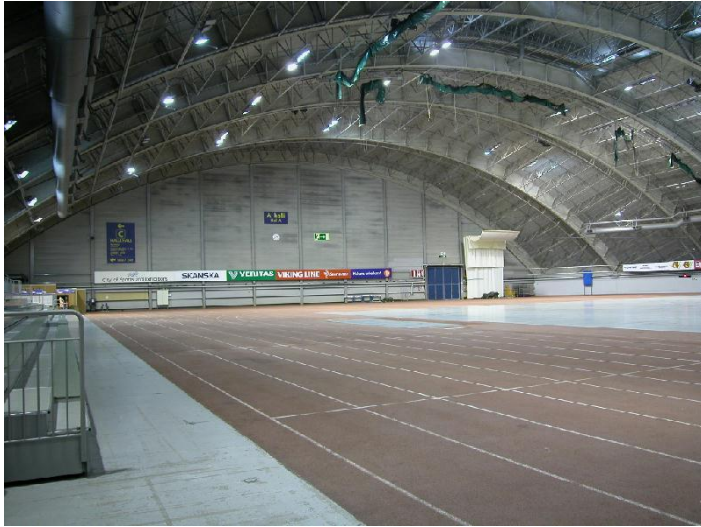
Tampereen messu- ja urheilukeskuksen A-halli eli Pirkkahalli, yleiskuva sisätilasta. 6.9.2007, Miia Hinnerichsen.