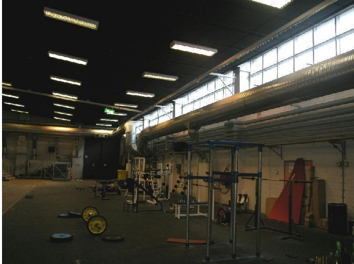
Ilmavoimien lentokonehallin, nykyisen Tampereen messu- ja urheilukeskuksen B-hallin sisätilat, yleiskuva voimistelu- yleisurheiluhallista. 6.9.2007, Miia Hinnerichsen.