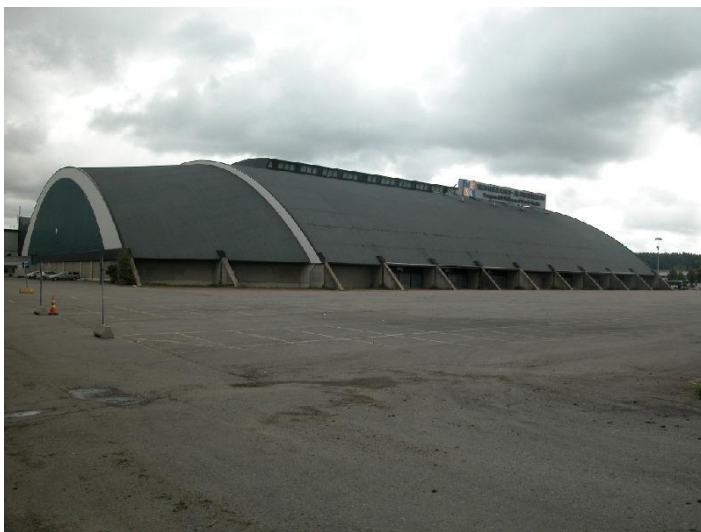
Tampereen messu- ja urheilukeskuksen A-halli eli Pirkkahalli, lounaissivu. 6.9.2007.

Rakennus on arkkitehtonisesti merkittävä ja vaikuttava, jopa monumentaalinen. Historialliset ja sosiaalishistorialliset arvot liittyvät rakennuksen käyttöön ja toimintahistoriaan paikallisesti ja kansallisesti merkittävänä messu- ja urheiluhallina. Rakennuksen sijainti on maisemallisesti keskeinen. Se sijaitsee näkyvällä paikalla Tampereen eteläisen ohitustien varressa ja toimii maamerkkinä ympäröiville alueille.