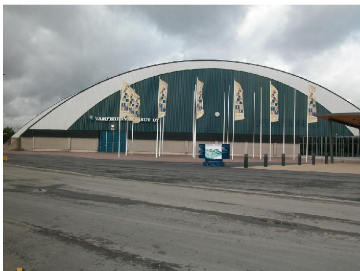
Tampereen messu- ja urheilukeskuksen A-halli eli Pirkkahalli, kaakkoispääty. 6.9.2007, Miia Hinnerichsen.