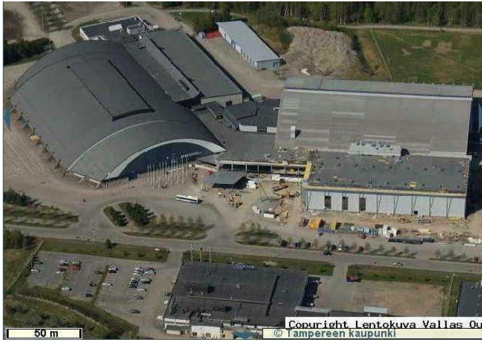
Viistoilmakuva Tampereen messu- ja urheilukeskuksesta kohti pohjoista. 20.5.2006