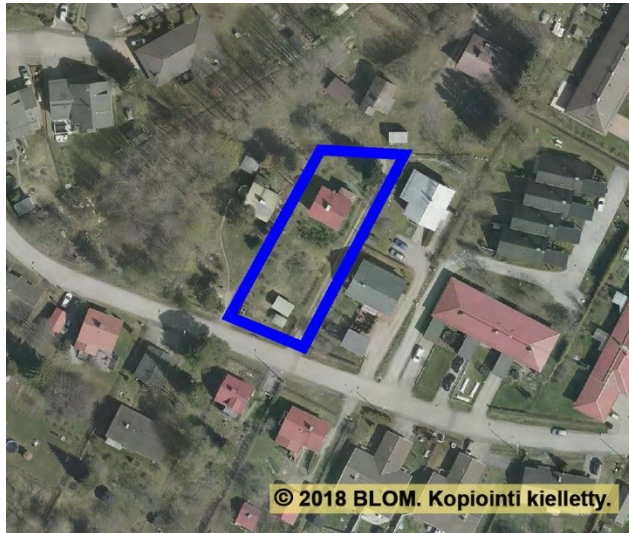
Ilmakuva ©BLOM 2018