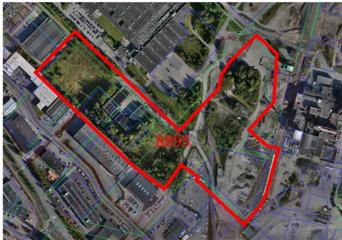
Ilmakuva asemakaavamuutoksen nro 8895 suunnittelualueesta