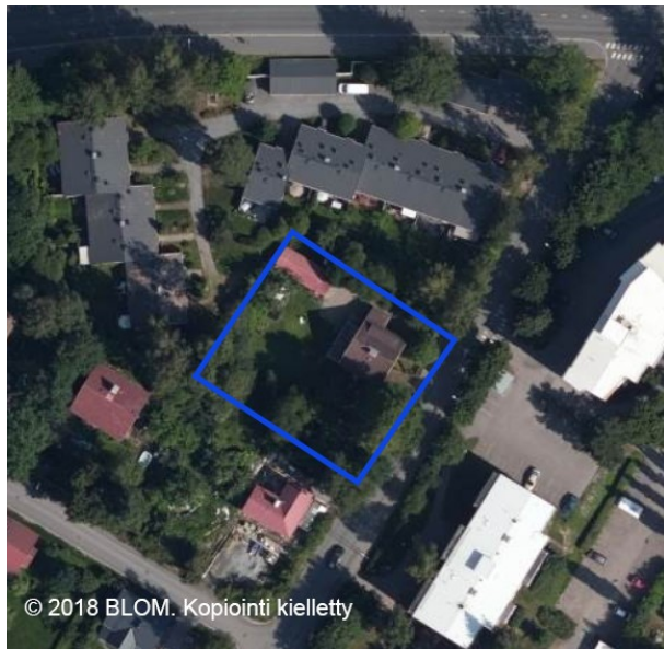
Ilmakuva 2018