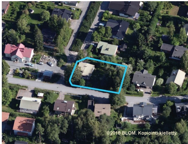
Ilmakuva 2018