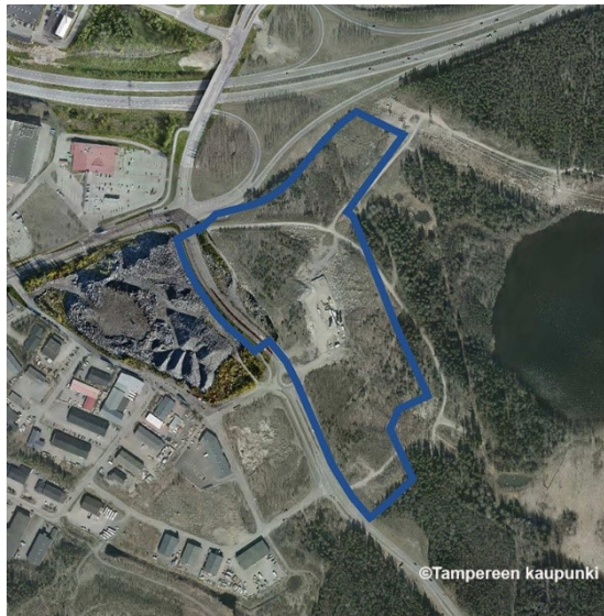
Ilmakuva suunnittelualueesta v.2018