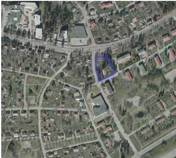
Suunnittelualue rajattu sinisellä ilmapuuvaa.