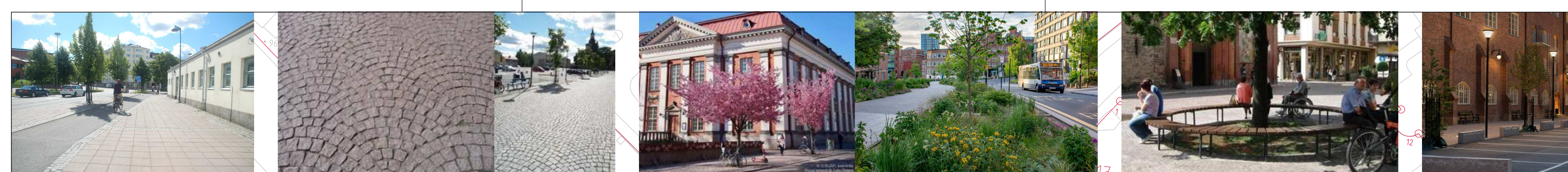
Jalkakäytävien pinnoitteena betonilaatta. Aukioiden pinnoitteena ristipähakattu noppakivi viuhkaladottuna. Kahden aukiolle sijoittuvan "mahtipuun" lisäksi Juhannuskylänkadulle ja Palokunnankadulle on suunniteltu kukkivien pienpuiden rivistöt. Juhannuskylänkadun kolmen läntisimmän puun istutus edellyttää hulevesiviemärin siirtoa. Puiden lisäksi vihreyttä katutilaan ja aukiolle tuovat monilajiset, kerrokselliset istutukset. Palokunnankadun uudella aukiolla "mahtipuuta" reunustaa istuin. Aukion valaistusesimerkki.