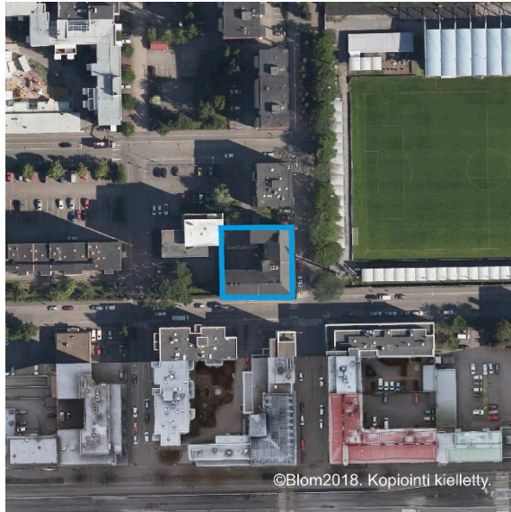
Kopiointi kielletty.