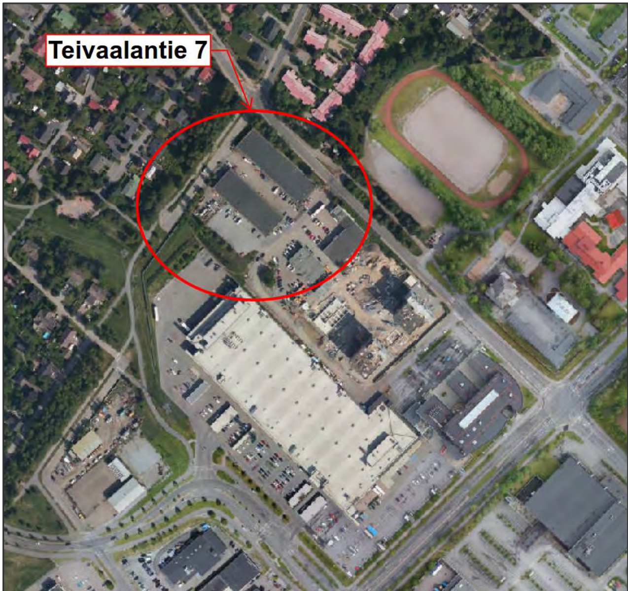
Kuva 2 Teivaalantie 7 nykytilanne ilmakuvassa

Kohteen sijaintikoordinaatit (ETRS89-TM35FIN) ovat P: 6825435 ja I: 322659. Kiinteistö rajautuu pohjoisessa Teivaalantiehen, kaakossa Teivaankujaan ja lännessä Viirapuistonkatuun. Kaakkoispuolella sijaitsee Prisma Lielahi kauppakeskus, kuva 2. Kiinteistö on vuoden 2006 yleiskaavassa kaavoitettu työpaikka-alueeksi. Kiinteistön käyttötarkoitus on muuttumassa asumiskäyttöön.