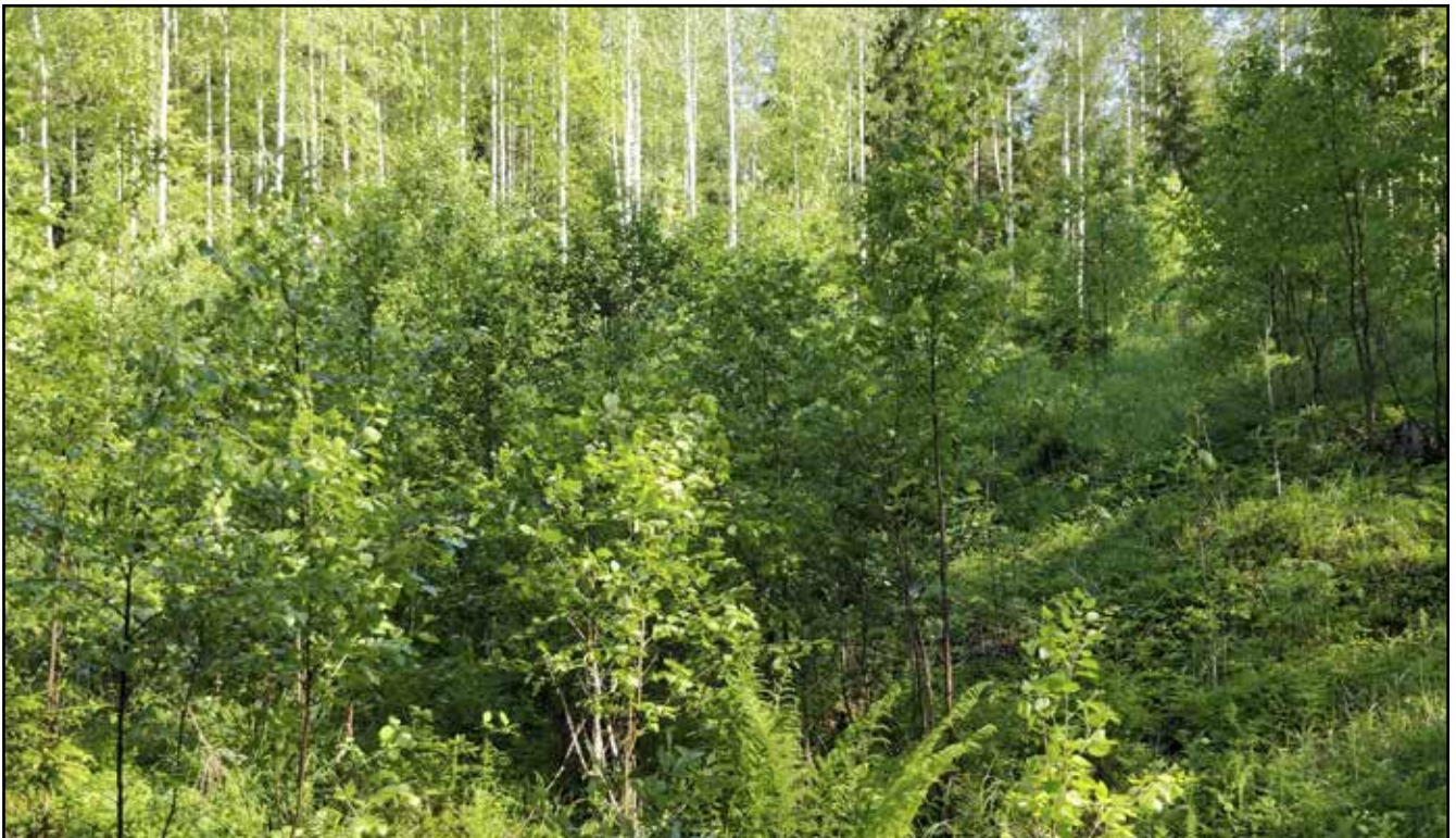
Alueen keskiosan tiheää taimikkoa.