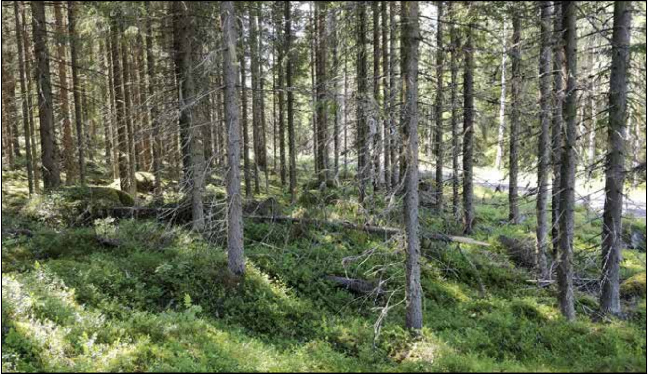
Tien pohjoispuolen tuoretta kangasta.