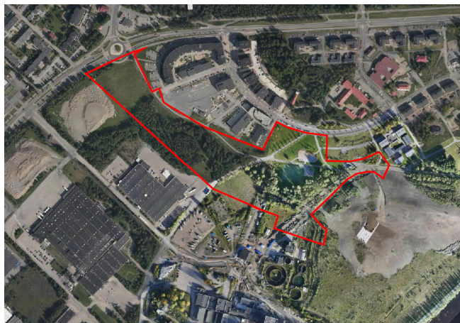
Ilmakuva asemakaavan 8771 suunnittelualueesta