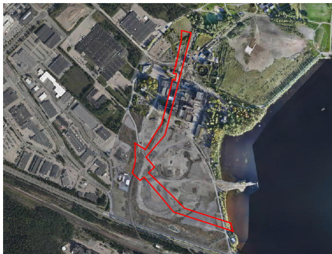
Ilmakuva asemakaavan 8770 suunnittelualueesta