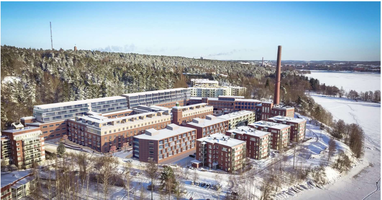
Alustava viitesuunnitelmaluonnos, ilmakuvasovitus, vaihtoehto 2 (Arkkitehdit Soini & Horto Oy).