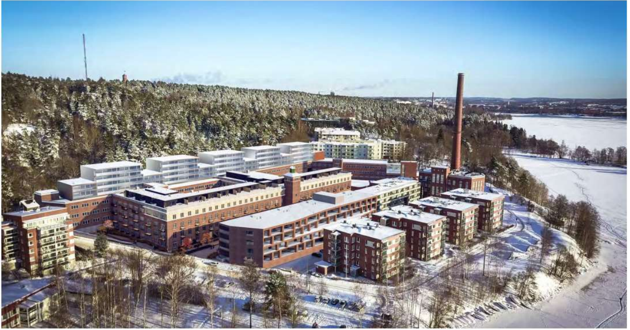
Alustava viitesuunnitelmaluonnos, ilmakuvasovitus, vaihtoehto 1 (Arkkitehdit Soini & Horto Oy).