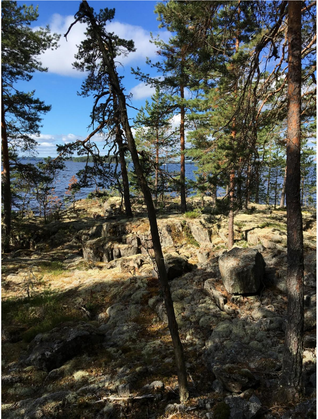
Kuva Kallioalueesta. Horisontissa Näsijärvi ja Harvassalo.