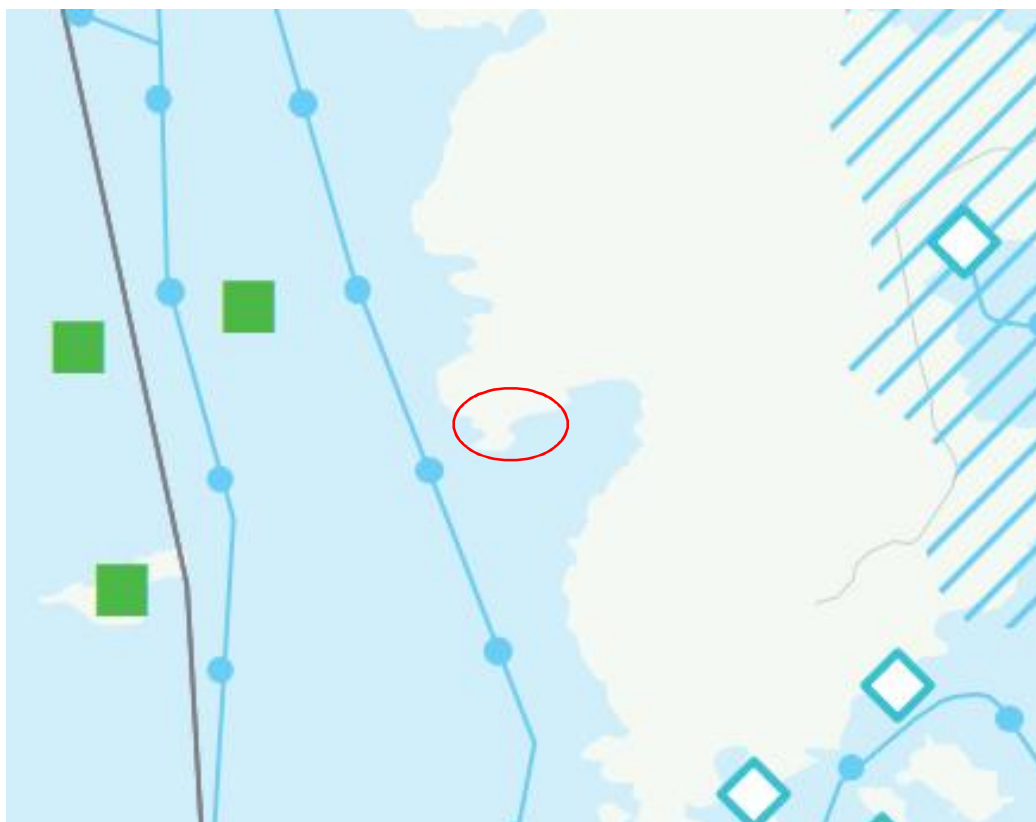
Ote Pirkanmaan maakuntakaavasta 2040. Kaava-alueen likimääräinen sijainti punaisella ympyrällä.

Merkinnällä osoitetaan alueet, jotka on ensisijaisesti tarkoitettu maa- ja metsätalouden ja niitä tukevien elinkeinojen käyttöön. Aluetta koskeva suunnittelumääräys mahdollistaa, että yksityiskohdaisemmassa suunnittelussa voidaan alueelle osoittaa vaikutuksiltaan paikallisesti merkittävää maankäyttöä.