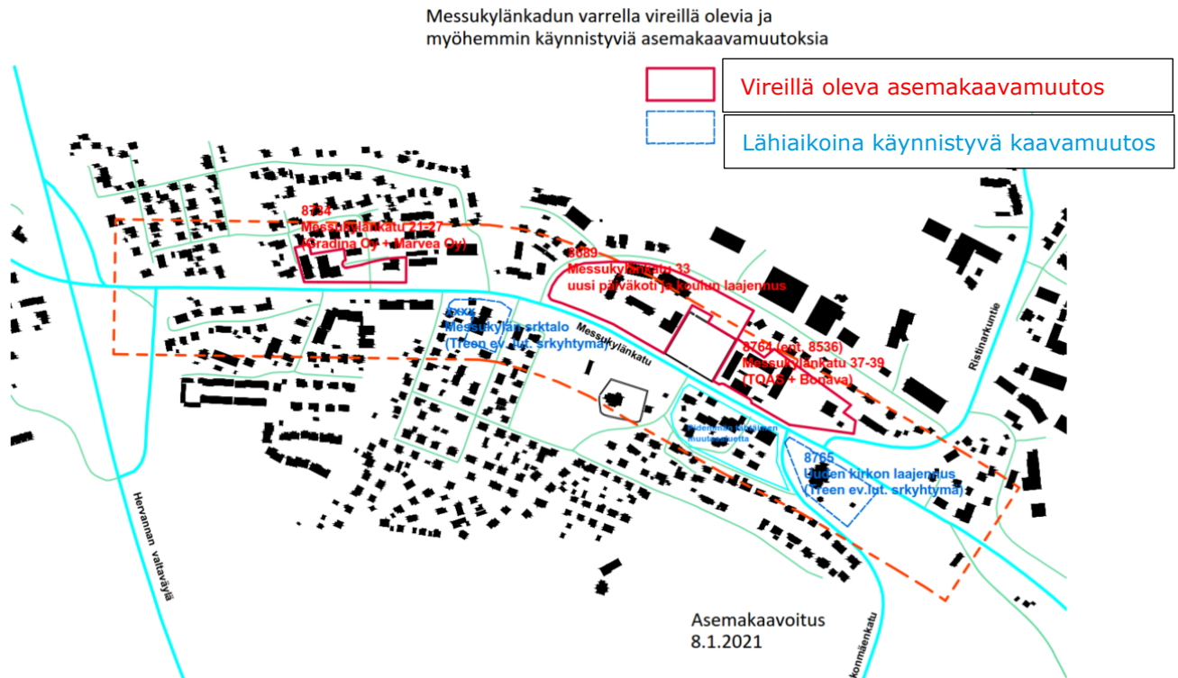
Kuva 1. Suunnittelualue

Tampereen kaupungin toimeksiannosta Ramboll Finland Oy on laatinut tämän lausunnon koskien Messukyläntien yleissuunnitelma-alueen asemakaavasuunnittelua. Lausunto koskee kuvassa 1 esitettyjä vireillä olevia ja tulevia kaavamuutoshankkeita ja lausunnossa otetaan kantaa rakentamisen ja pilaantuneiden maiden puhdistamisen vaikutuksiin alueen pohjaveteen.