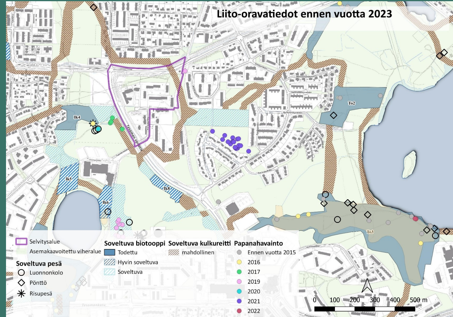
Kuva 1 Liito-oravahavainnot selvitysalueelta ja sen läheisyydestä ennen vuotta 2023.

Selvitys on tehty viranomaisohjeiden mukaisesti. Ajankohta selvityksen laatimiseen oli tänä vuonna hieman myöhäinen johtuen myöhäisestä keväästä. Lunta oli reilusti maassa vielä huhtikuun alkupuolella. Myöhäisestä keväästä johtuen kasvillisuus ei vielä toukokuun alussa peittänyt puiden tyviä, eikä puissa ollut lehtiä, joten liito-oravan papanoiden ja mahdollisten pesien havainnointi oli vaivatonta. Selvitys ei sisällä merkittäviä epävarmuustekijöitä ja sen katsotaan sisältävän riittävät tiedot alueen asemakaavoituksen pohjaksi.