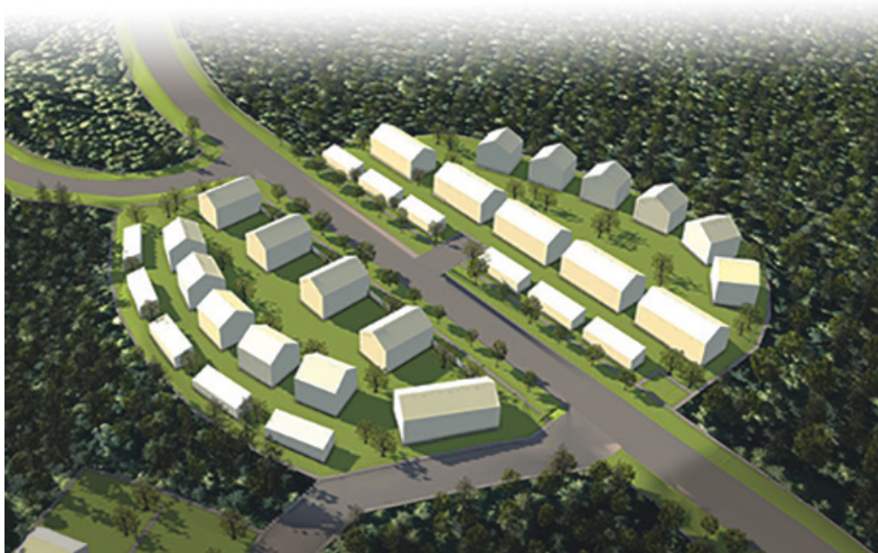
Pohjoinen portti pohjoisen suunnasta.