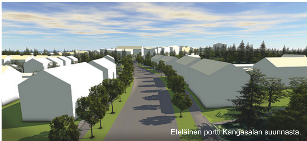
Eteläinen portti Kangasalan suunnasta.

Maastoon sovitukseen tulee kiinnittää erityistä huomiota. Puistonpuoleisilla rajoilla tulee noudattaa maaston luonnollisia korkeustasoja. Katuun rajoittuvilla rajoilla maaston korkeus sovitetaan kadun korkotasoon. Pihaille ja tonttien rajoille ei saa muodostua rumia vaikeasti hoidettavia jyrkkiä luiskia. Tarvittaessa korkeuseroja hoidetaan tukimuureilla. Kulkureitit toteutetaan mahdollisimman esteettöminä ja loivina. Jyrkemmillä rinnealueilla rakennukset voidaan toteuttaa rinneratkaisuin siten, että alin kerros upotetaan osittain rinteeseen.