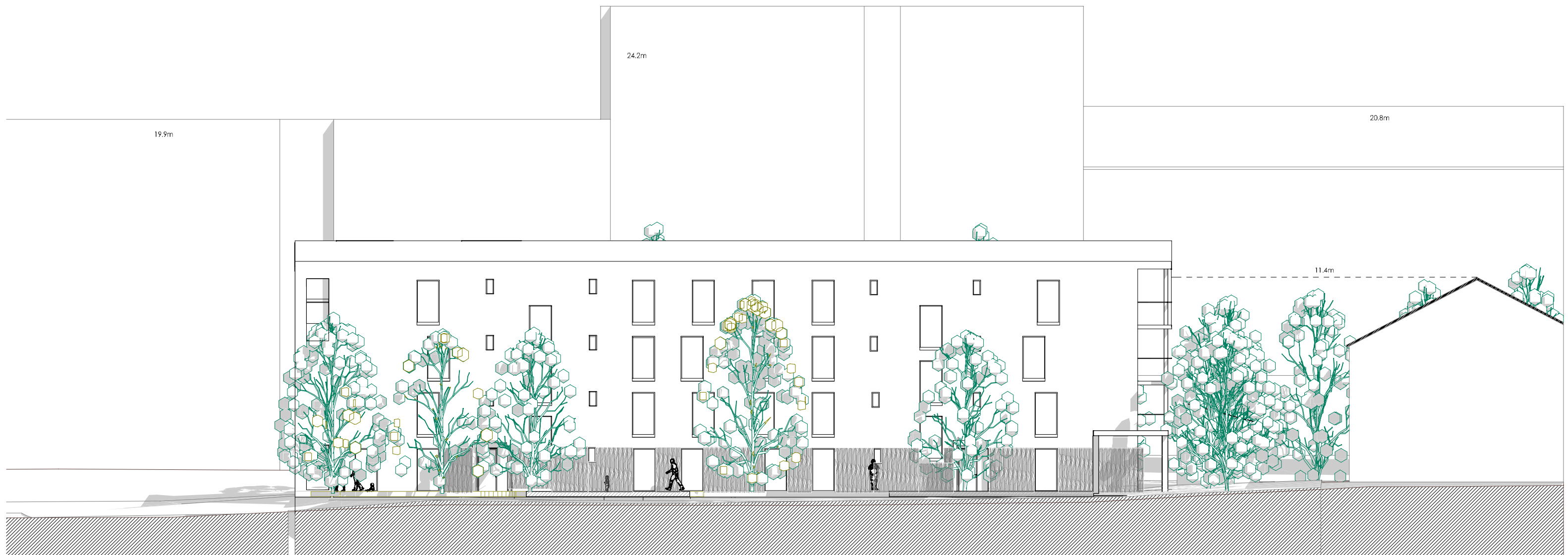
Julkisivu 001: 1.200 itään