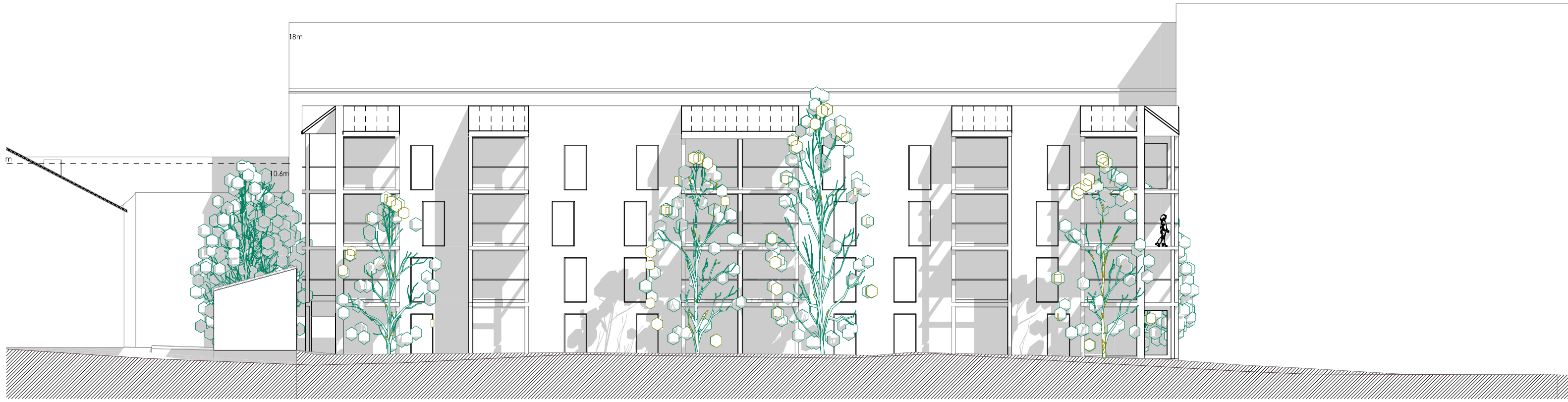
Julkisivu 004: 1.200 länteen