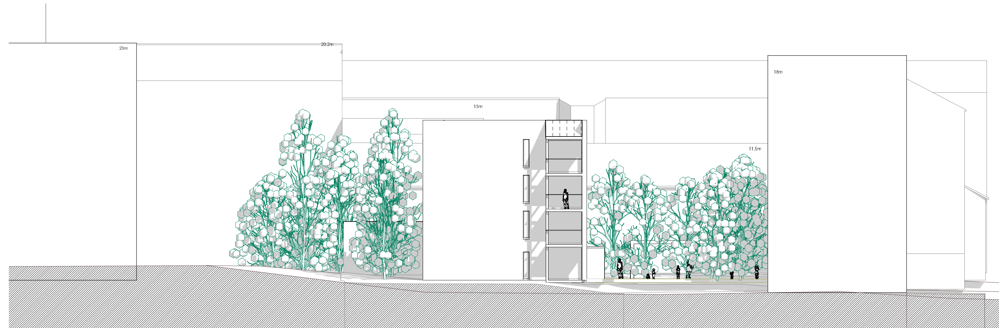
Julkisivu 002: 1.200 pohjoiseen