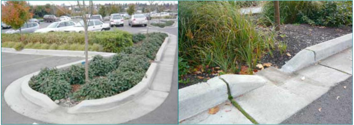
Kuva 1. Esimerkki pysäköintialueen huleveden imeytyspainanteesta (lähde: Hulevesiopas, kuntaliitto, 2012)