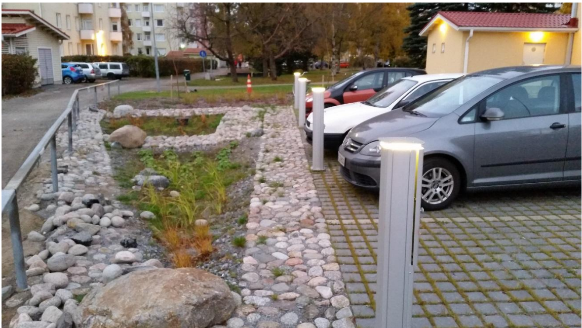
Kuva 2. Esimerkki tontin huleveden imeytyspainanteesta

Katto- ja piha-alueiden kerättävät hulevedet viivytettäisiin maanpäällisissä imeytyspainanteissa. Asemakaavan mukainen huleveden hallinta on esitetty liitteessä 3.