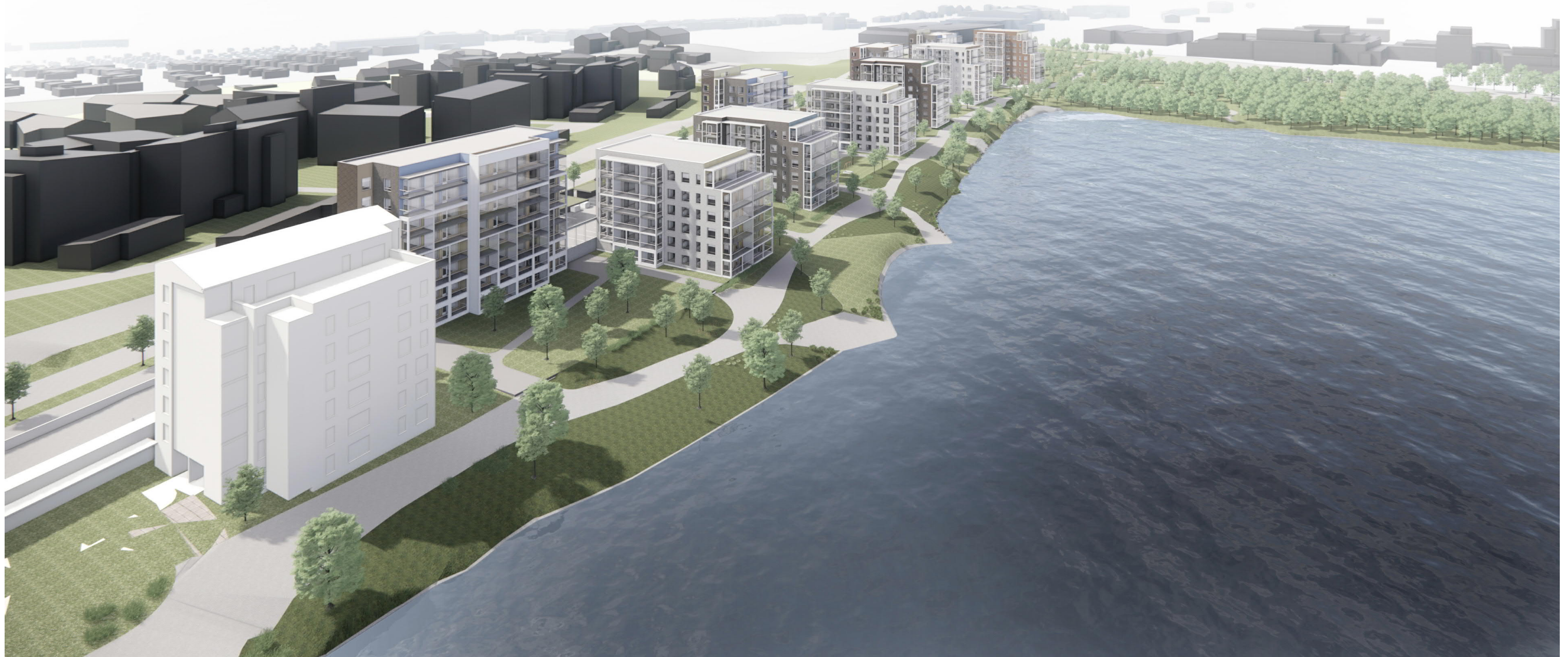
TOHLOPINRANTA - VIITESUUNNITELMA