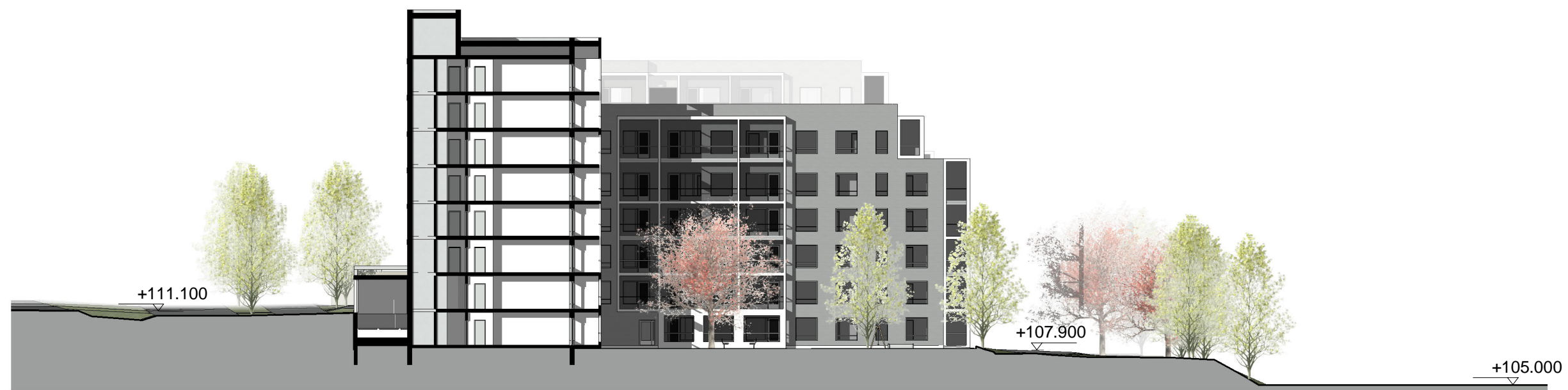
Leikkaus B-B 1:400