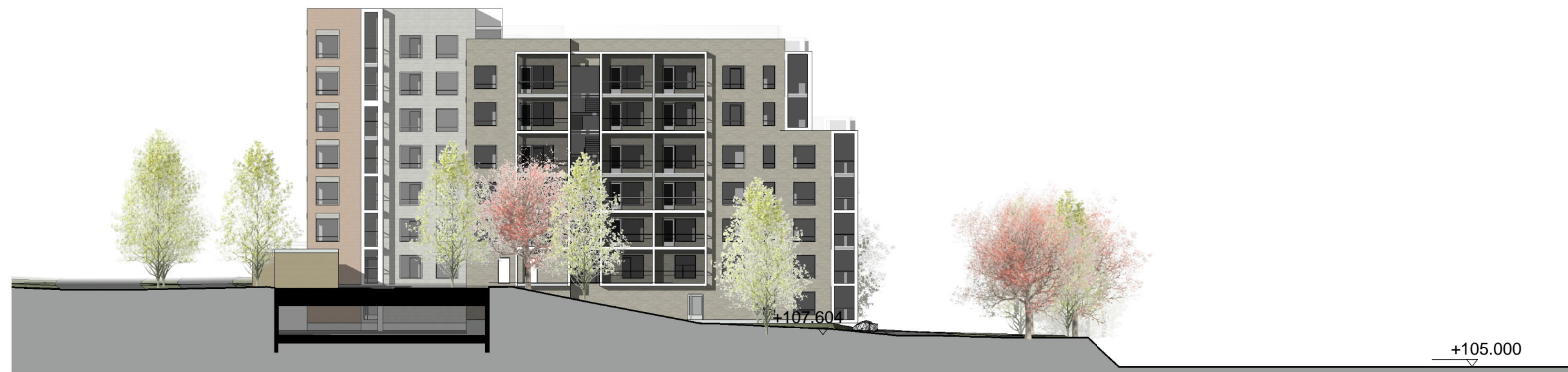
Leikkaus A-A 1:400