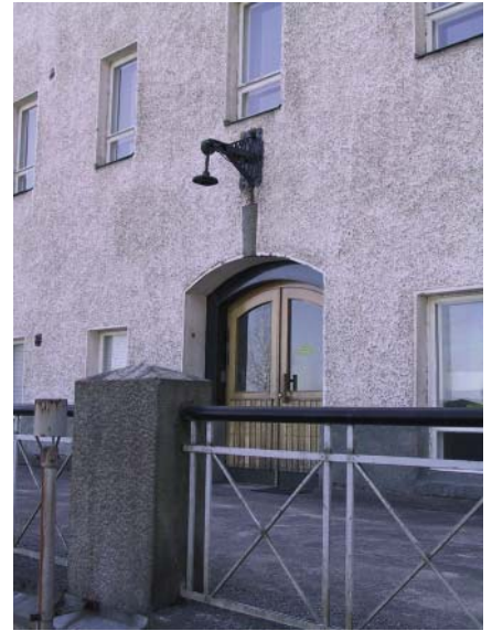
Vanha terassi ja lamppu