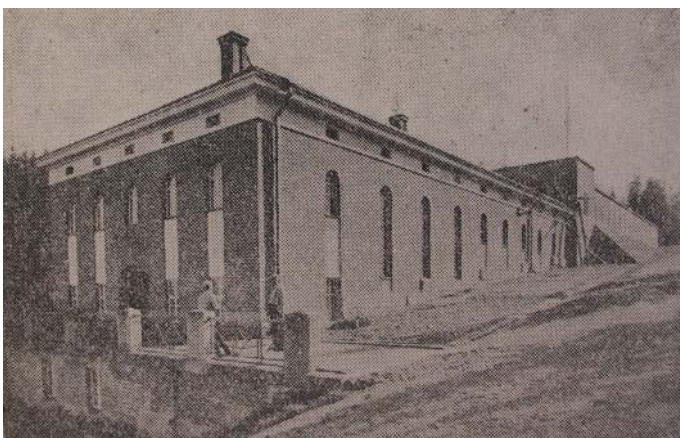
Pumppuasema ennen muutoksia 1940-luvulla