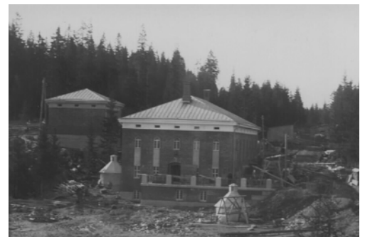
Kuva on otettu rakennusvaiheessa 1920-luvulla