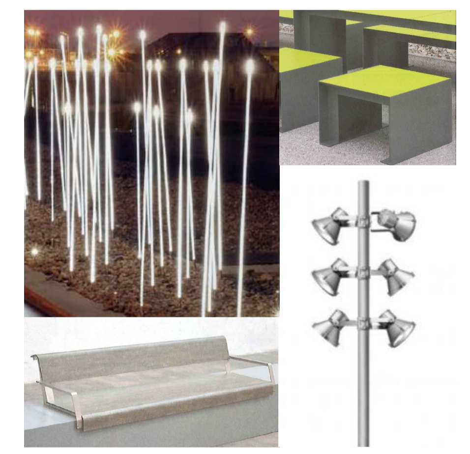
ESIMERKKEJÄ KALUSTEISTA, TAIDEAIHEESTA JA VALAISTUKSESTA Värisävyinä harmaat ja tehosteväriin keltainen

Kasvillisuus on istutusalueella matalaa, näyttävää ja vuodenaikojen mukaan muuttuvaa. Kasvillisuutena on perennojen lisäksi sipulikkukia ja matalia maanpeitekasveja. Aukiolle on varattu paikka mahdolliselle taideteokselle sekä erityisvalaistukselle.