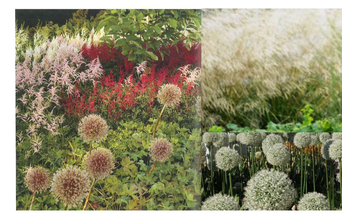
ESIMERKKEJÄ ISTUTUSALUEEN KASVILLISUUDESTA Lehtien ja kukkien värisävyinä lämpimän vaaleat ja punertavat sävyt