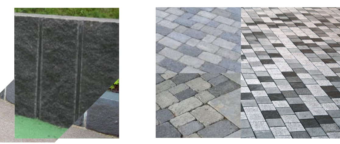
ESIMERKKEJÄ ISTUTUSALUEEN MUURISTA JA AUKION KIVEYKSESTÄ Muuri tummaa graniittia ja kiveys sekävärinen musta-harmaa-valkoinen betoni/luonnonkiveys