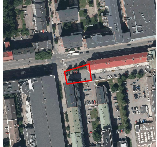
Ilmakuva kaava-alueesta v. 2011