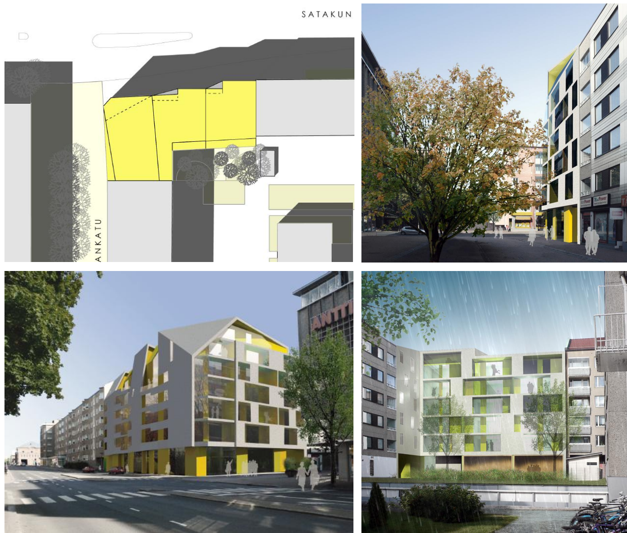
Tontinluovutuskilpailun voittajaehdotuksen asemapiirros sekä näkymät Kuninkaankadulta, Satakunnankadulta ja sisäpihalta. Arkkitehtitoimisto Lahdelma & Mahlamäki Oy.

Arvosteluryhmän tekemään arvosteluun ja kiinteistötoimen esitykseen perustuen kaupunginhallitus päätti 5.3.2012, että tontti varataan 31.8.2013 saakka VVO Kodit Oy:lle Arkkitehtitoimisto Lahdelma & Mahlamäki Oy:n tekemien suunnitelmien mukaista hankeselvitystä varten.