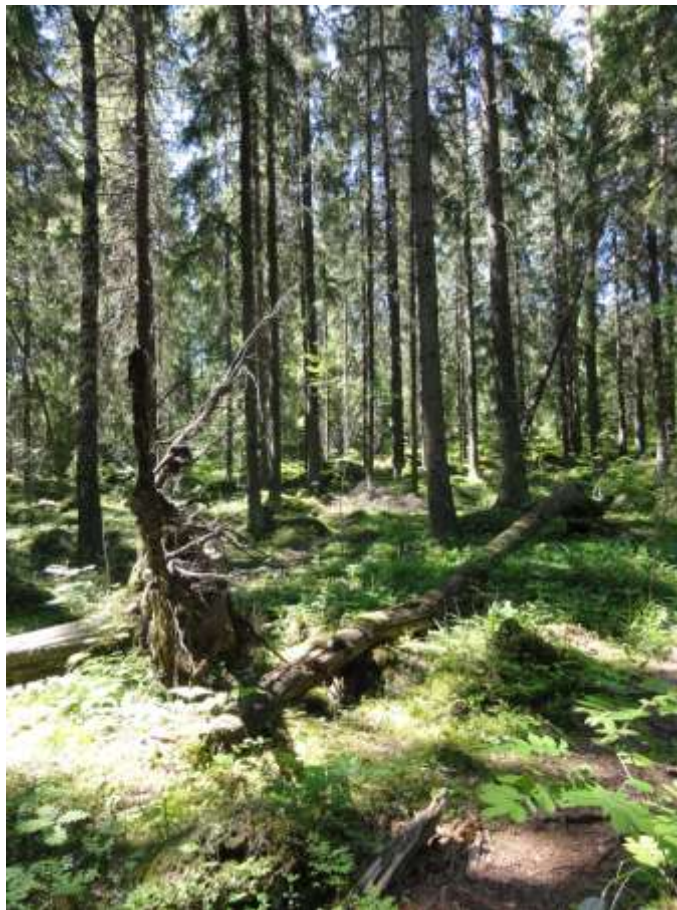
Kuva 16. Kuvion 23 metsää.

Puusto on lähinnä kuusta ( Picea abies ), mutta muutama harva pihlajantaimi ( Sorbus aucuparia ) löytyy. Pohjakerroksessa kasvaa sammalta, ja kariketta on paikoin runsaasti.