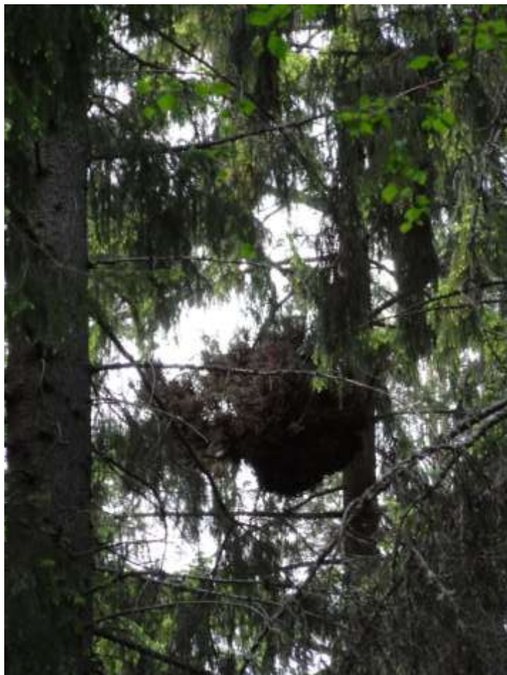
Kuva 22. Risupesät sopivat hyvin liito-oravien pesimäpaikoiksi.

Liitekarttaan 4 on merkitty aikaisemmat ja selvityksen yhteydessä tehdyt papanahavainnot ja havaintovuodet sekä alueella merkittävimmät liito-oravalle soveltuvat elinympäristöt. Liitekarttaan on myös merkitty Pärinkosken-Peltolammin luonnonsuojelun liito-oravan tunnetut elinympäristöt oranssilla värillä.