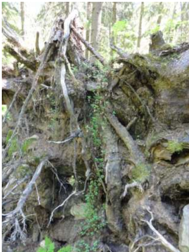
Kuva 2. Tuulenkaato, jossa kasvaa vanamoaa kuvion 2 tihkupinnan läheisyydessä.