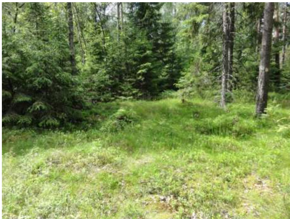
Kuva 18. Aukea Käärmemäellä kuviolla 24.

Käärmemäellä on aukea kallionlakialue, jossa kasvaa pihlajaa, haapaa, herukkaa, sananjalkakasvustoja sekä aitovirnaa ( Vicia sepium ). Aluetta reunustavat kuuset.