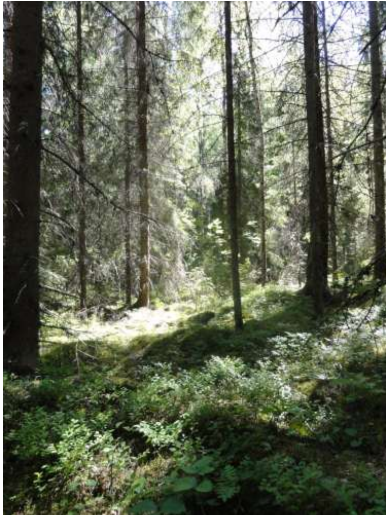
Kuva 5. Ojitettua korpea kuviolla 7.

Ojitetun korven poikki kulkee sähkölinja. Alueella näkyy selkeästi ojituksen vaikutukset: suo on metsittynyt ja maasto kuivaa (kuva 5). Sähkölinjan kohdalla kulkee pitkospuut ja valtalojeina on kiiltopaju ( Salix phylicifolia ) ja korpikaisla (kuva 6). Ojituksen vuoksi tällä kohdin veden pinta on korkealla. Merkittäviä luontoarvoja tällä korvella ei ole eikä ole todennäköinen metsälätkökohta.