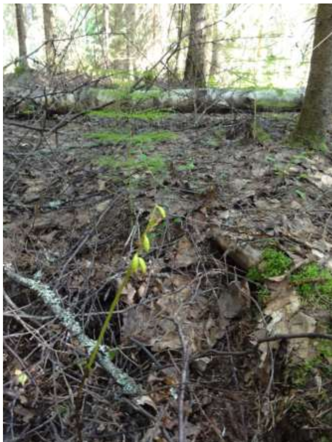
Kuva 1. Harajuuri kuviolla 1 lähteen vieressä.

Korven reunassa on pieni lähde. Puusto on kuusivaltaista, iältään noin 40-vuotiasta ja kenttäkerroksen kasvillisuus on niukkaa. Kasvupaikkatyypiltään alue on mustikkakorpea. Alue on ojitettu, mikä on vaikuttanut alueen vesitasapainoon. Pohjakerros on peittynyt karikkeesta, jonka seassa kasvoi hiukan metsäkortetta ja mustikkaa. Alueelta löydettiin harajuuri ( Corallorhiza trifida , RT), lähteen läheltä (kuva 1). Lähteen ympäristössä ei ollut tyypillistä lähteiden kasvillisuutta. Mustikkakorpi on yleisin ns. varsinaisten korpien tyypeistä. Koska kohde on ojitettu, se ei ole todennäköinen vesi- tai metsälakikohde.