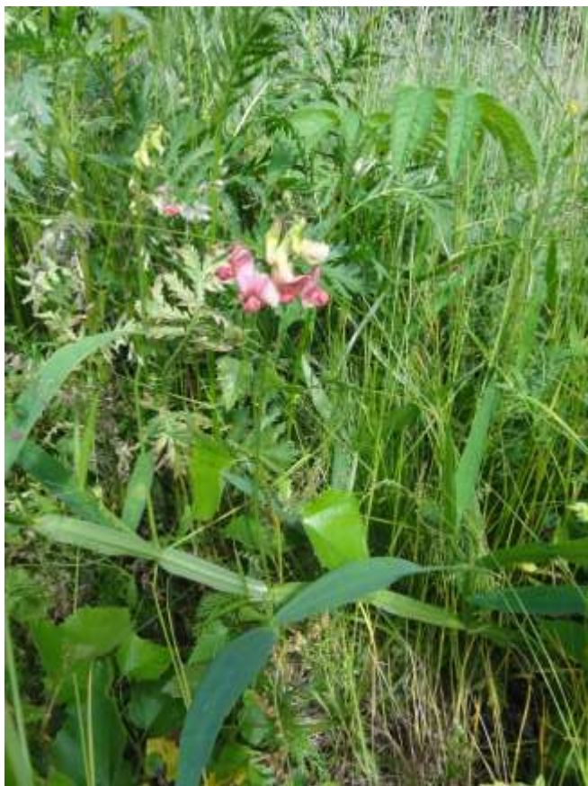
Kuva 21. Metsänätkelmää radan varrella.

Metsänätkelmä ( Lathyrus sylvestris ) löytyi selvitysalueelta lehtolaikulta kuviolta 6. Metsänätkelmä kasvaa rehevissä rinnemetsissä, metsänreunoissa, pensaikoissa, tienvarsilla ja –penkareilla sekä joutomailla. Tampereen seudulla metsänätkelmä ei ole kovin yleinen. Metsänätkelmää tavattiin myös selvitysalueen ulkopuolella rautatien vieressä hiekkatien varrella.