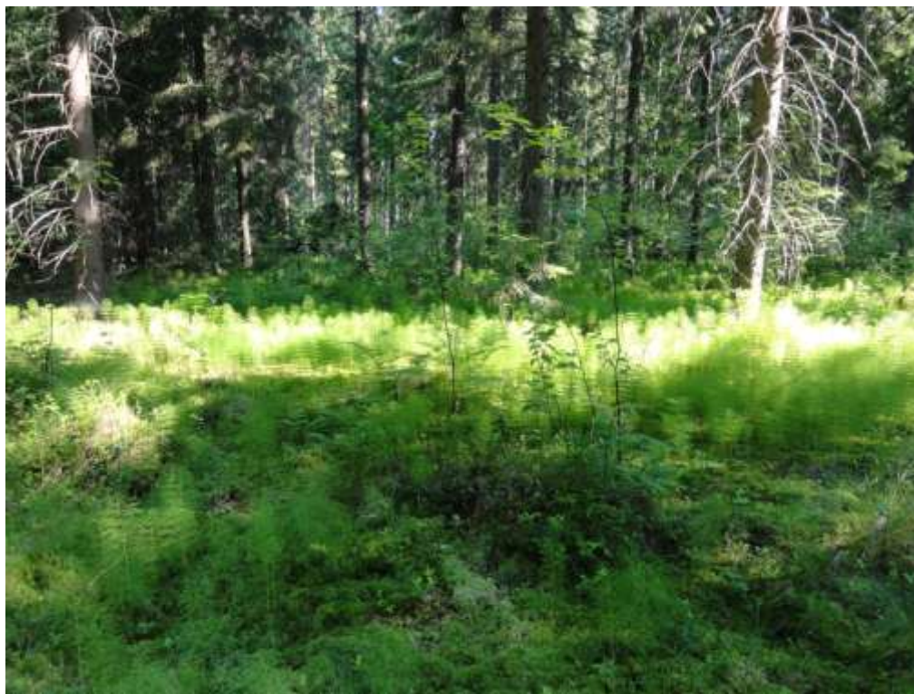
Kuva 13. Metsäkortekorpi Levolla kuviolla 21.