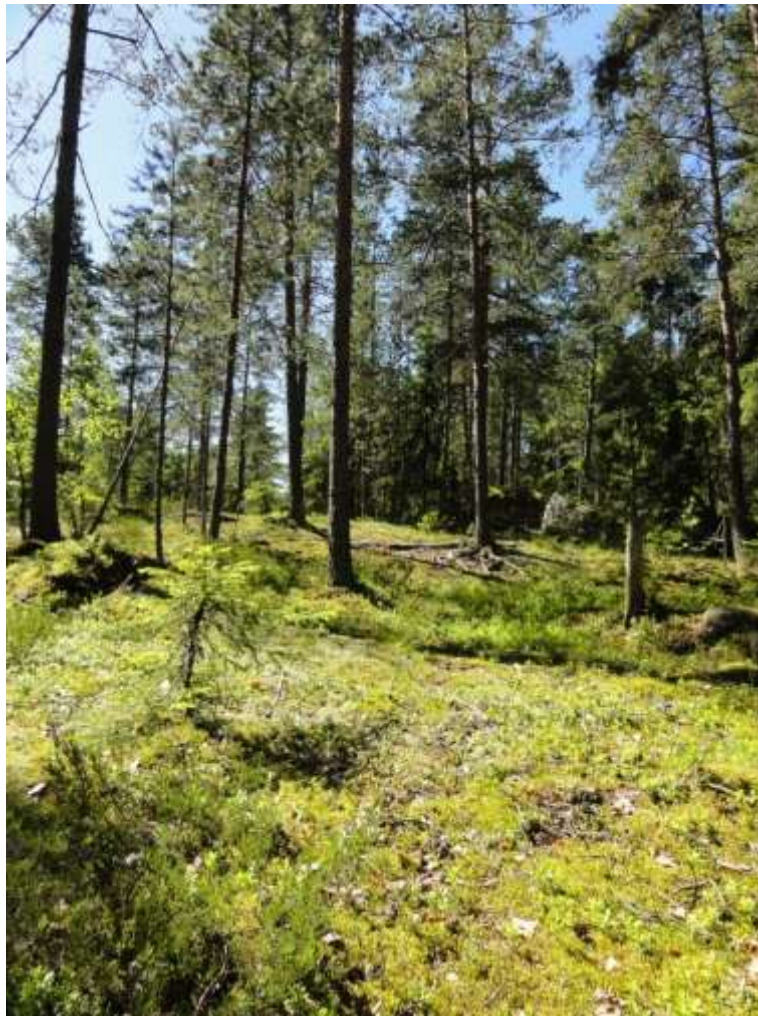
Kuva 19. Kuivaa kangasta kuviolla 25.