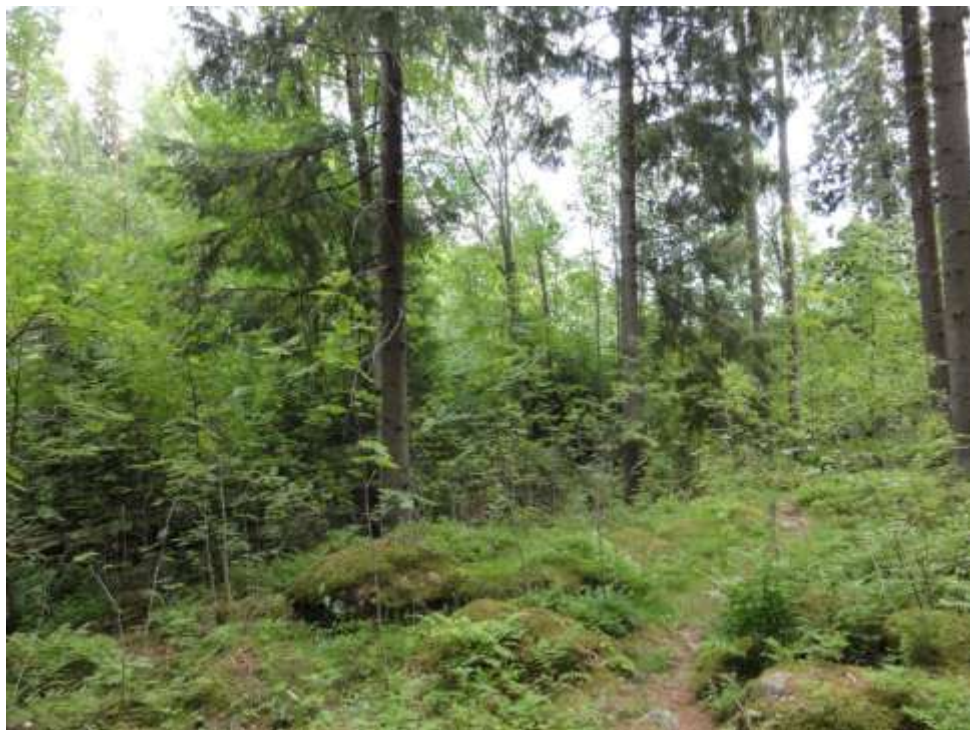
Kuva 11. Kuvion 14 haavikon reunaa