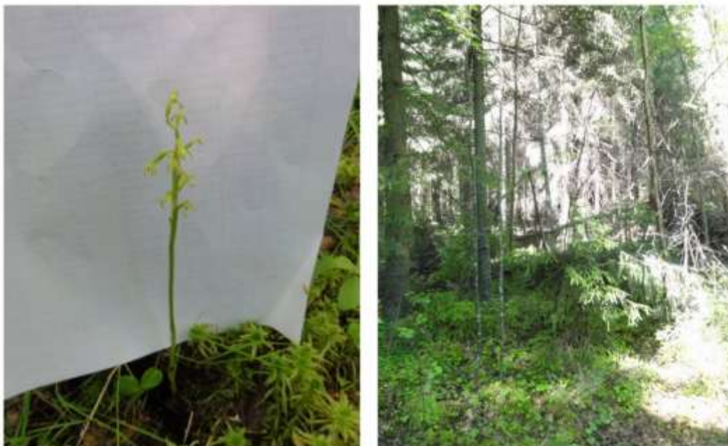
Kuva 20. Harajuuri ( Corallorhiza trifida ) ja harajuuren kasvuympäristö metsäkuviolla 9 (oikealla)

Isovesirikko ( Elatine alsinastrum ) on uposlehtikasvi. Isovesirikko kasvattaa 5–40 cm pitkän pystyn tai kohenevan, suikertelevan varren. Isovesirikko kasvaa savisissa ojissa, savenotto-kuopissa ja vesihaudoissa matalassa vedessä tai joskus täysin upoksissa. Suomessa lähes kaikki kasvupaikat ovat ihmisen muovaamia. Perinteisen laidunnuksen loppuminen, salaojitus sekä lammikoiden umpeenkasvu ja kuivaaminen ovat suuresti vähentäneet isovesirikolle sopivia kasvupaikkoja. Isovesirikon levinneisyysalue on laaja, mutta se on kaikkialla harvinainen ja Suomessa on määritelty erittäin uhanalaiseksi (EN) kasviksi. Isovesirikkoa esiintyy ELY-keskuksen tietojen mukaan Levon pohjoispäässä. Tämän selvityksen yhteydessä vesirikkoa ei havaittu.