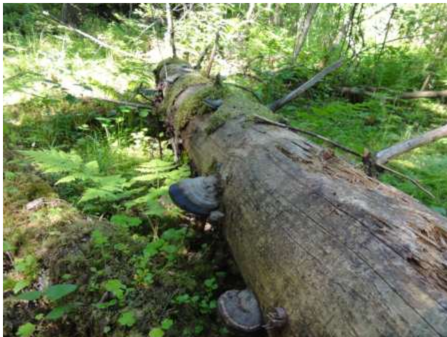
Kuva 17. Kuviolla 23 on paljon keloja ja kääpäkasvustoja.