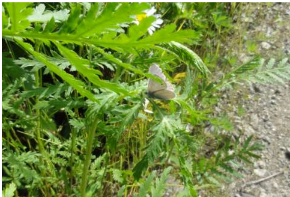
Kuva 24. Kesän kuluttama ja jo pahoin haalistunut virnasinisiipi

varsilla. Elinympäristöltään se vaatii runsasta lajistoa erilaisia hernekasveja. Radanvarren keto- kasvillisuutta tulisi vaalia, jolloin virnasinisiiven säilyminen alueella voidaan varmistaa. Kaavoituksessa tulisi huomioida virnasinisiiven esiintyminen selvitysalueen vieressä.