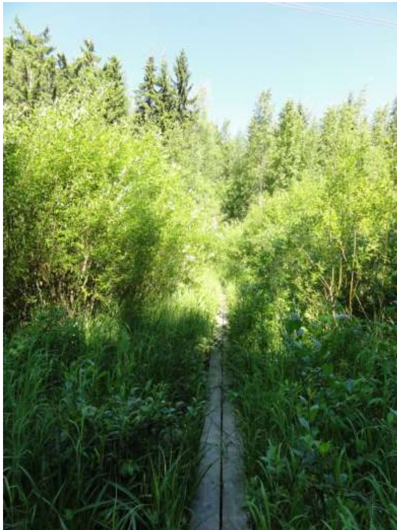
Kuva 6. Kuvion 9 poikki kulkee pitkospuut sähkölinjan alta.