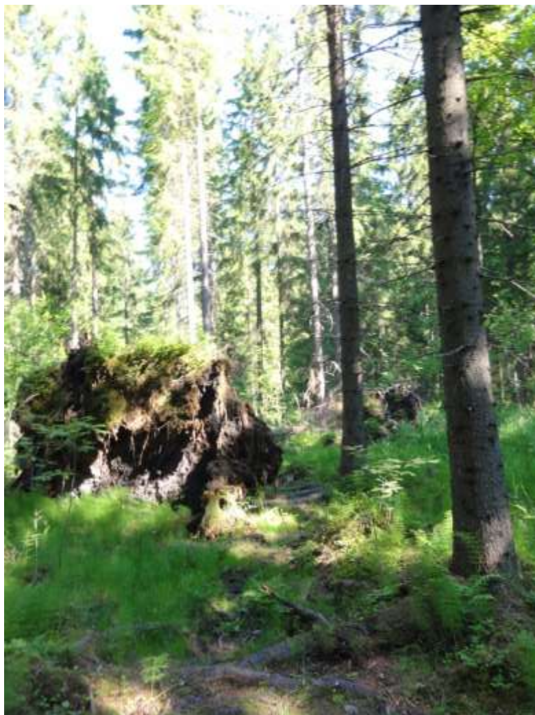
Kuva 23. Tuulenkaatoja korven reunassa kuviolla 21, missä lepakkoja saalisti.

Selvitysalueen eteläosa (Arranmaa-Levo) on lepakoille tärkeä saalistusalue (luokka II). Vaikka lepakot voivat saalistaa jopa kymmenien kilometrien päästä lepopaikastaan, ne yleensä suosivat päiväpiilojensa lähetyviltä löytyviä saalistuspaikkoja. Tärkeänä saalistusalueena voidaan pitää sellaista paikkaa, missä lepakoita havaitaan runsaasti ja/tai useilla kartoituskerroilla. Lepakot vaihtelevat kesän aikana saalistusalueita, mistä saattaa johtua ettei eteläosassa havaittu lepakkoja kesäkuussa.