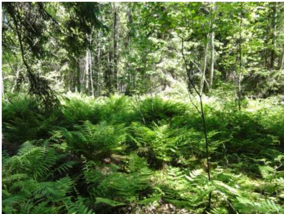
Kuva 7. Saniaiskorpea kuviolla 8.