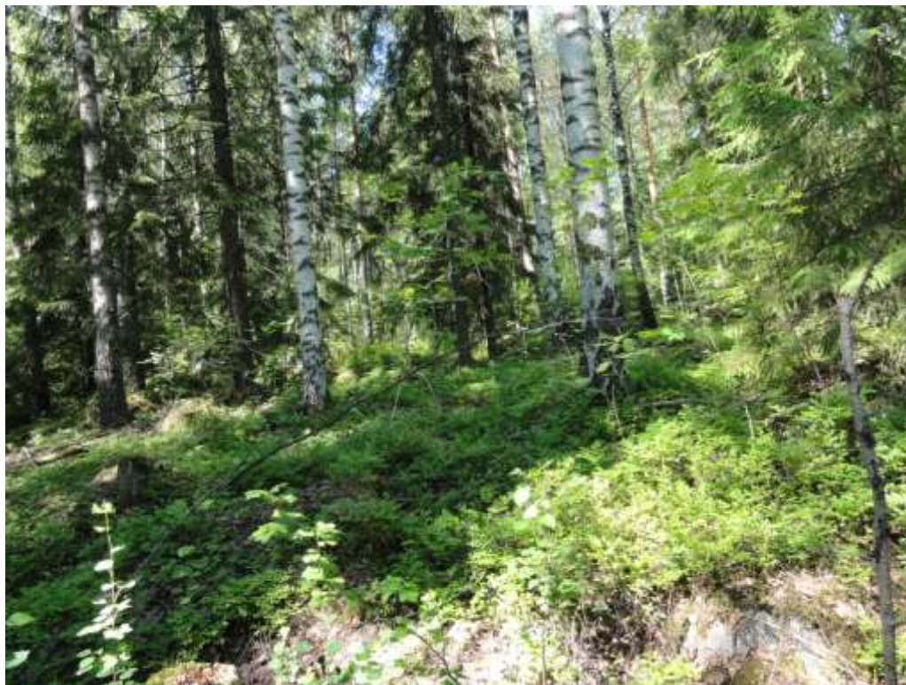
Kuva 10. Lehtokorpea kuviolla 11.