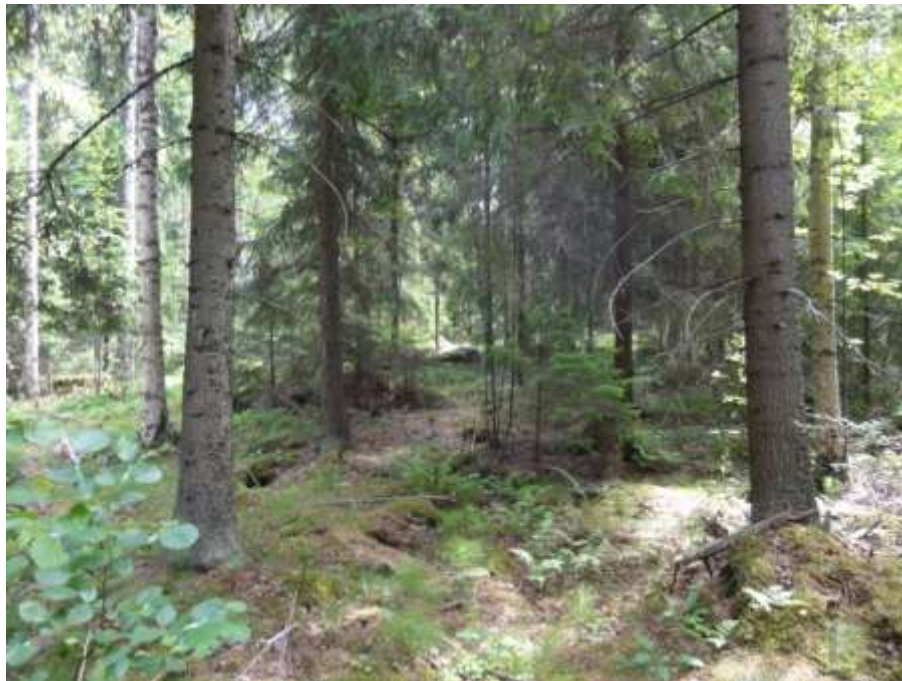
Kuva 3. Kuvion 3 puusto on sekapuustoa.