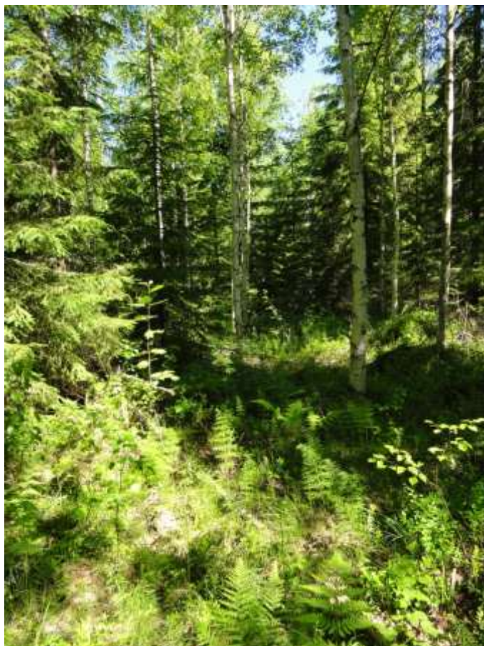
Kuva 15. Pieni metsäkortekorpi selvitysalueen rajalla

Metsäkortekorpea löytyy aivan selvitysalueen rajalta jatkuen Pirkkalan kunnan puolella. Puusto on koivua, pihlajaa ja kuusta. Maasto on osin melko kuivaa, mutta selviä merkkejä ojituksesta ei ole. Kohdetta on kuitenkin muutettu eikä siten ole luonnontilainen.