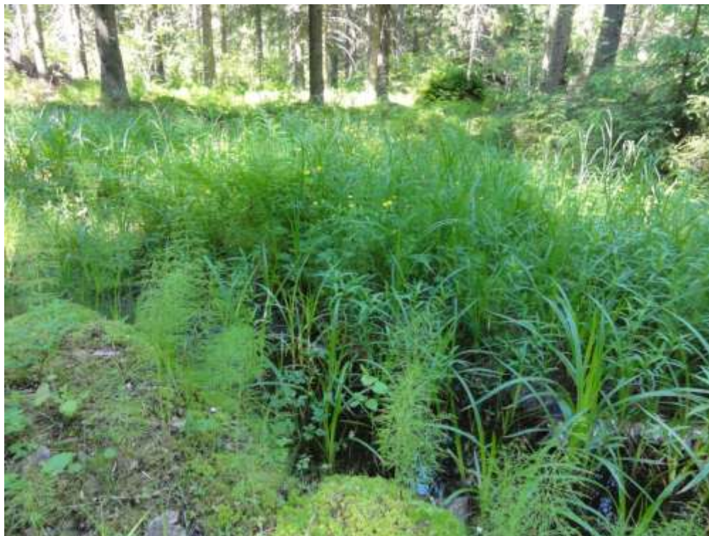
Kuva 14. Metsäkortekorpi kuviolla 5 vaihtuu heinä- ja ruohokorveksi, jossa kasvaa runsaasti korpikaislaa.