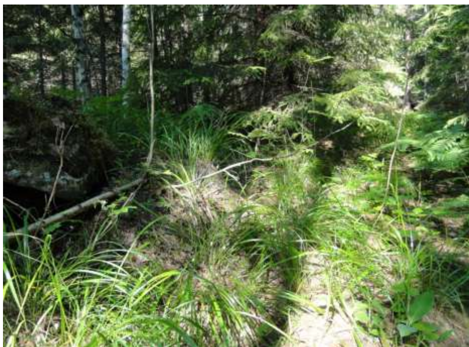
Kuva 4. Lehtoisen alueen reunalla kuviolla 4 kasvaa runsaasti metsäkastikkaa.