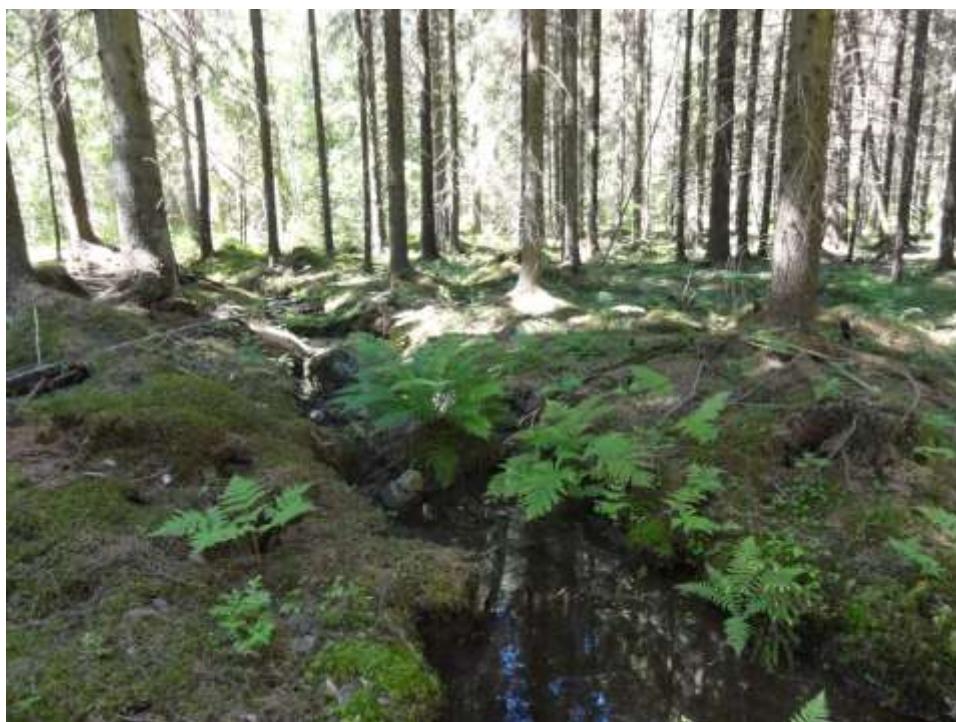
Kuva 8. Kuvion 9 ojat ovat melko syviä.