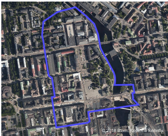
Ortokuva v.2018 BLOM