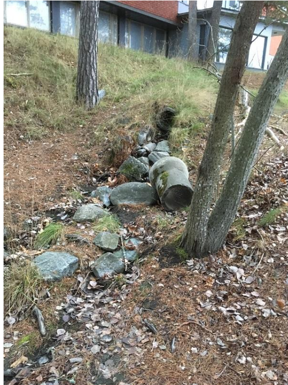
Kuva 3. Majalan eteläpuolella oleva hulevesien nykyinen purkukohta, valuma-alue D.

Uudella suunnitelmalla ei ole vaikutusta alueen eroosioriskiä, sillä suunnitelman mukainen saunarakennus rakennetaan aivan rantaa ja kattovedet johdetaan suoraan järveen.