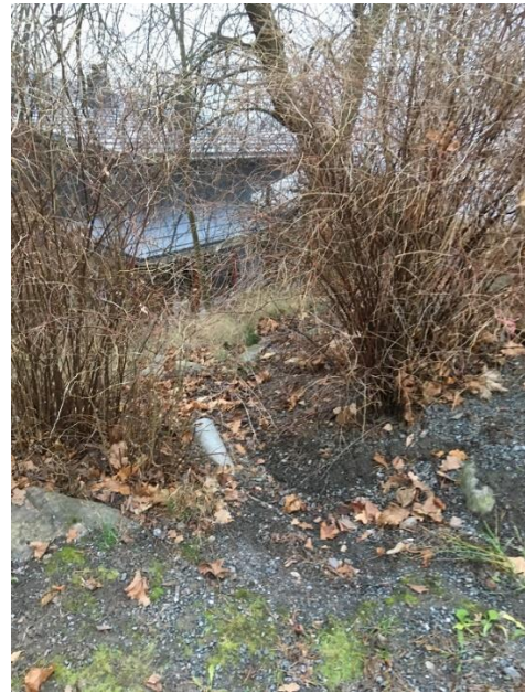
Kuvat 4a ja 4b. a) Päärakennuksen eteläpuolella oleva betoninen hulevesikaivo. b) Hulevesien purkupiste saunarakennuksen länsipuolella rinteen yläpäässä.

Purkupisteiden eroosiota voidaan ehkäistä vähentämällä johdettavaa hulevesimäärää käyttämällä vettä läpäiseviä pintamateriaaleja ja johtamalla hulevesiä esim. painanteisiin, säätelämällä viivytysrakenteen avulla virtaaman suuruutta sekä eroosiosuojamalla purkupiste. Purkupisteen eroosiosuojauksessa voidaan käyttää sijainnista riippuen esim. rakennettua kivipesää tai käyttäen luonnonmukaisia eroosiosuojauksia kuten suojaustarkoitukseen valittua kasvillisuutta tai rinnekohdissa esim. geotekstiilejä.