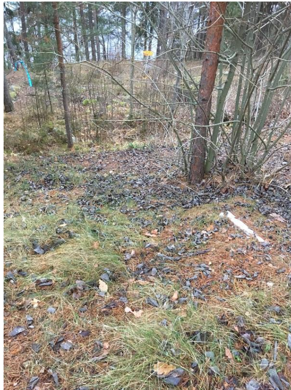
Kuva 2. Majalan lounaispuolella oleva hulevesien nykyinen purkukohta, valuma-alue C.

Uusi majoitus- ja urheilusalin sijoittuu alueiden B ja C osalle. Eroosioriski ei kasva, jos kattovedet johdetaan alueelle B tai johdetaan rinteeseen lounaisosaan erillisen viivytys-/imeytyskaivon kautta. Purku eroosiosuojataan.