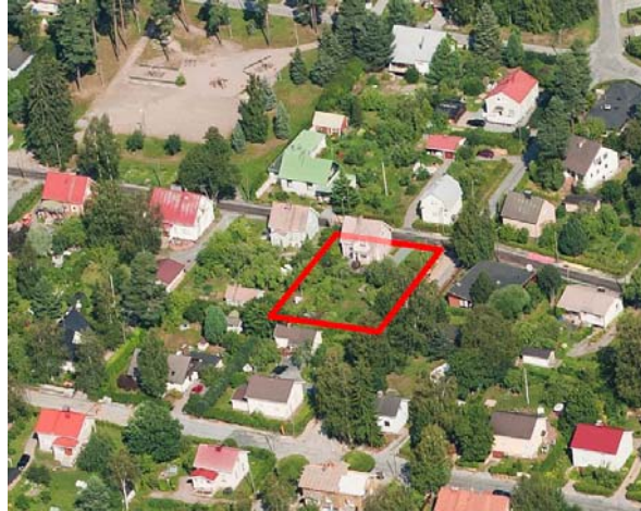
Ilmakuva kaava-alueesta, vuodelta 2010.