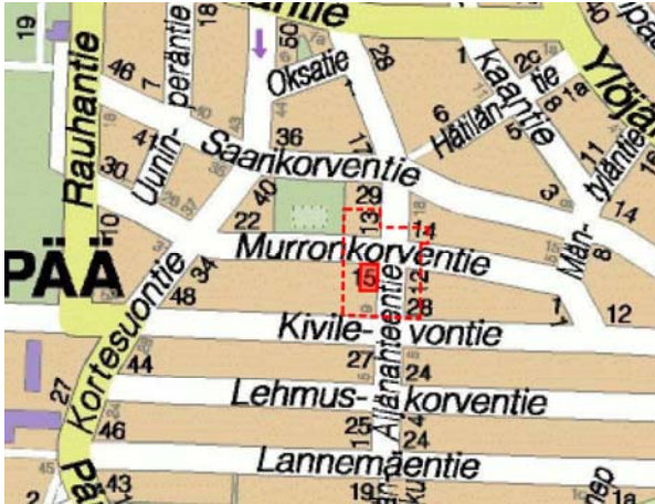
Kaava-alue, lähivaikutusalue katkoviivalla.