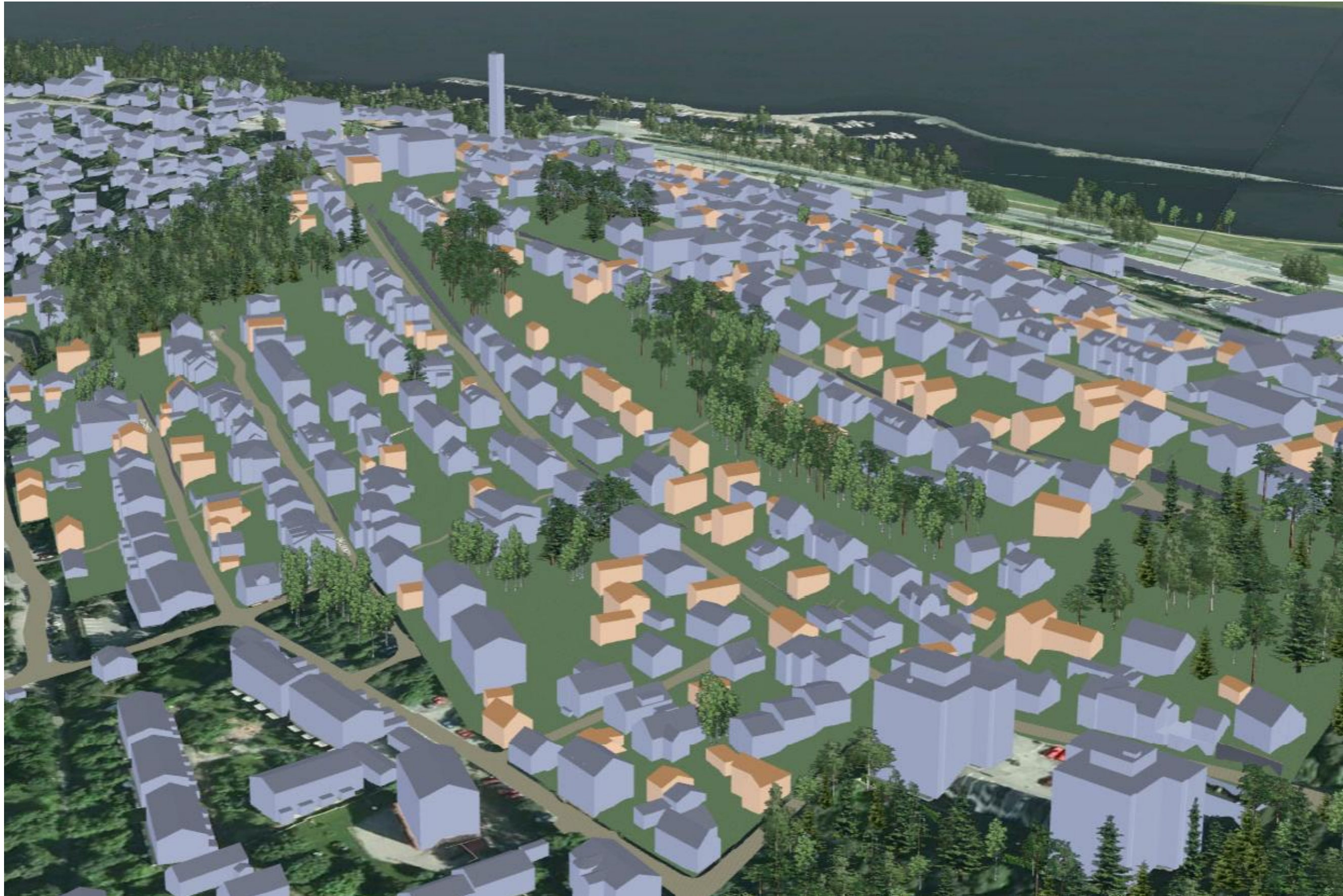
KUVA 6/6: ILMAKUVA KAAKOSTA

YLÄ-PISPALA, ASEMAKAAVAN MUUTOS, PISPALAN ASEMAKAAVAN UUDISTAMISEN I -VAIHE, KAAVAT 8256 JA 8257. LUONNOS. Tampereen kaupunki, Kaupunkiympäristön kehittäminen, maankäytön suunnittelu 20.2.2012.