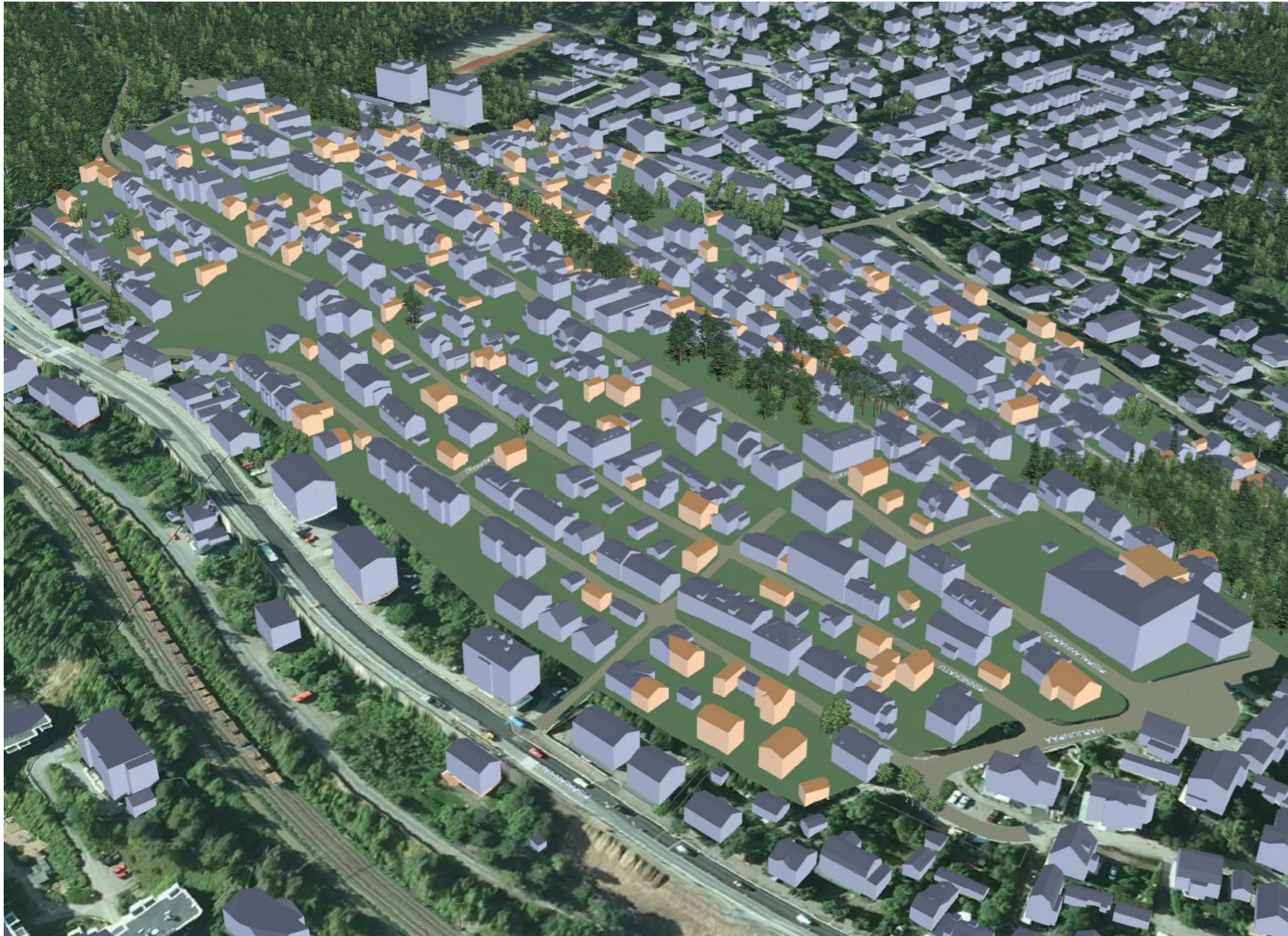
KUVA 3/6: ILMAKUVA LUOTEESTA

YLÄ-PISPALA, ASEMAKAAVAN MUUTOS, PISPALAN ASEMAKAAVAN UUDISTAMISEN I -VAIHE, KAAVAT 8256 JA 8257. LUONNOS. Tampereen kaupunki, Kaupunkiympäristön kehittäminen, maankäytön suunnittelu 20.2.2012.