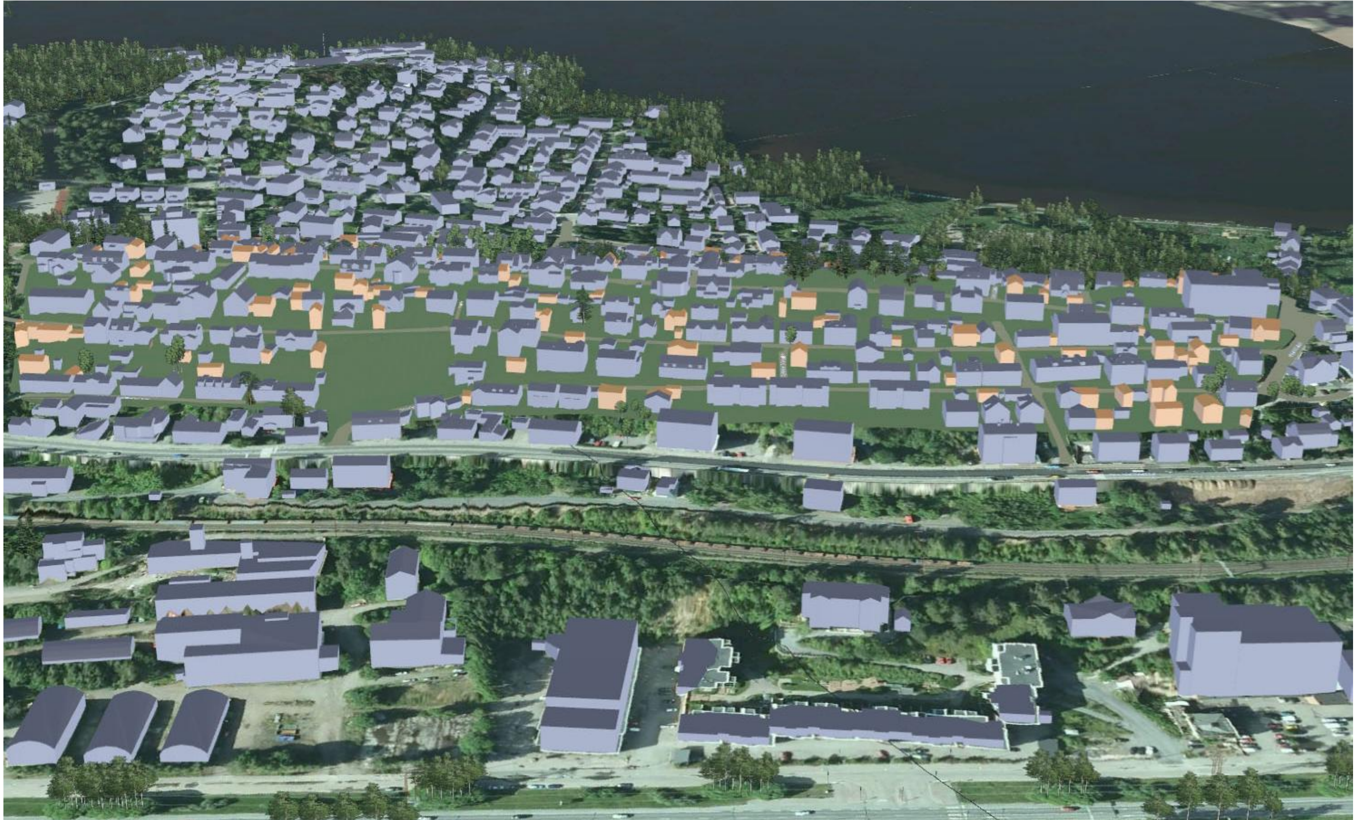
KUVA 2/6: ILMAKUVA POHJOISRINTEESTÄ

YLÄ-PISPALA, ASEMAKAAVAN MUUTOS, PISPALAN ASEMAKAAVAN UUDISTAMISEN I -VAIHE, KAAVAT 8256 JA 8257. LUONNOS. Tampereen kaupunki, Kaupunkiympäristön kehittäminen, maankäytön suunnittelu 20.2.2012.