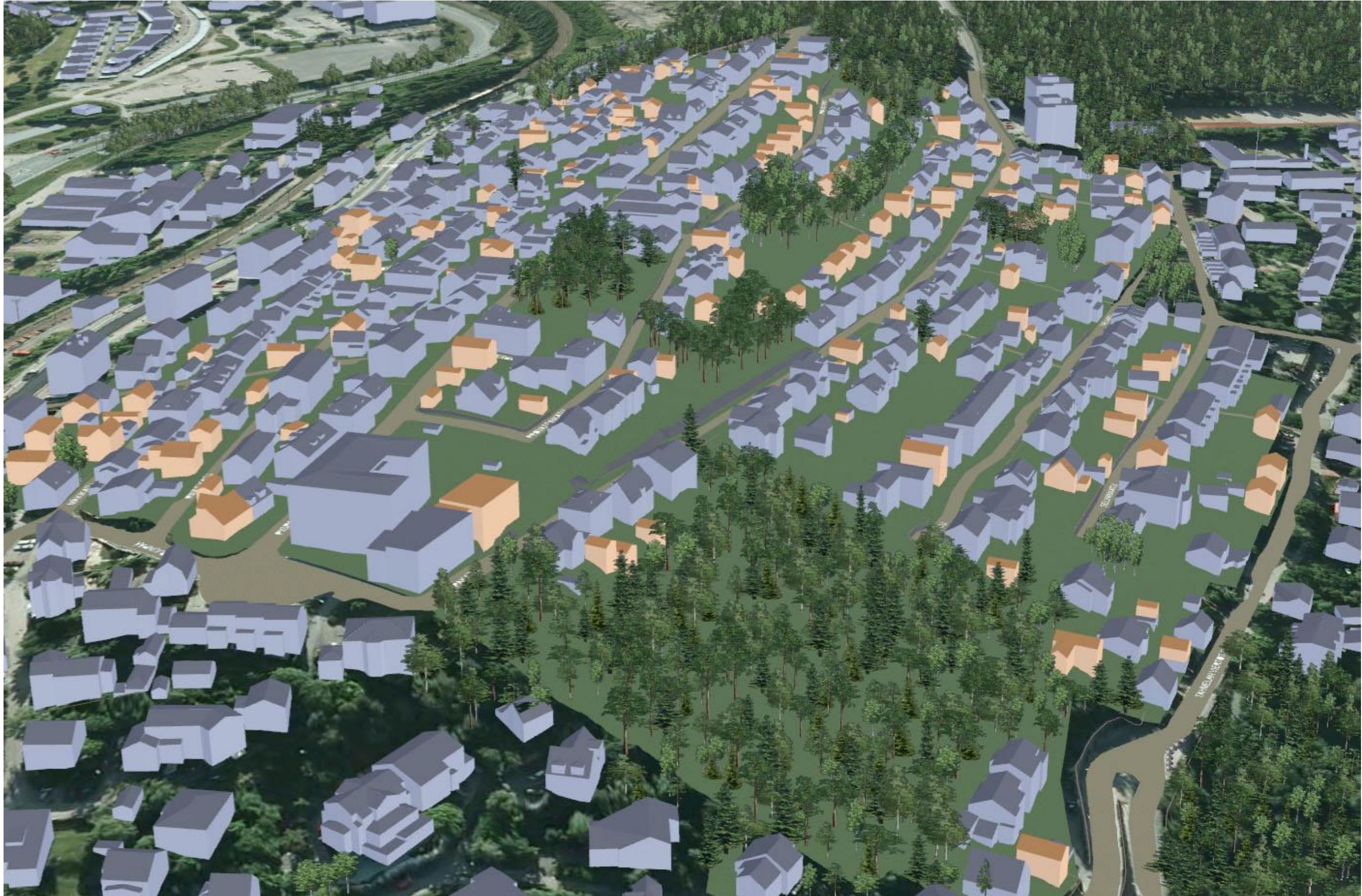
KUVA 4/6: ILMAKUVA LÄNNESTÄ

YLÄ-PISPALA, ASEMAKAAVAN MUUTOS, PISPALAN ASEMAKAAVAN UUDISTAMISEN I -VAIHE, KAAVAT 8256 JA 8257. LUONNOS. Tampereen kaupunki, Kaupunkiympäristön kehittäminen, maankäytön suunnittelu 20.2.2012.