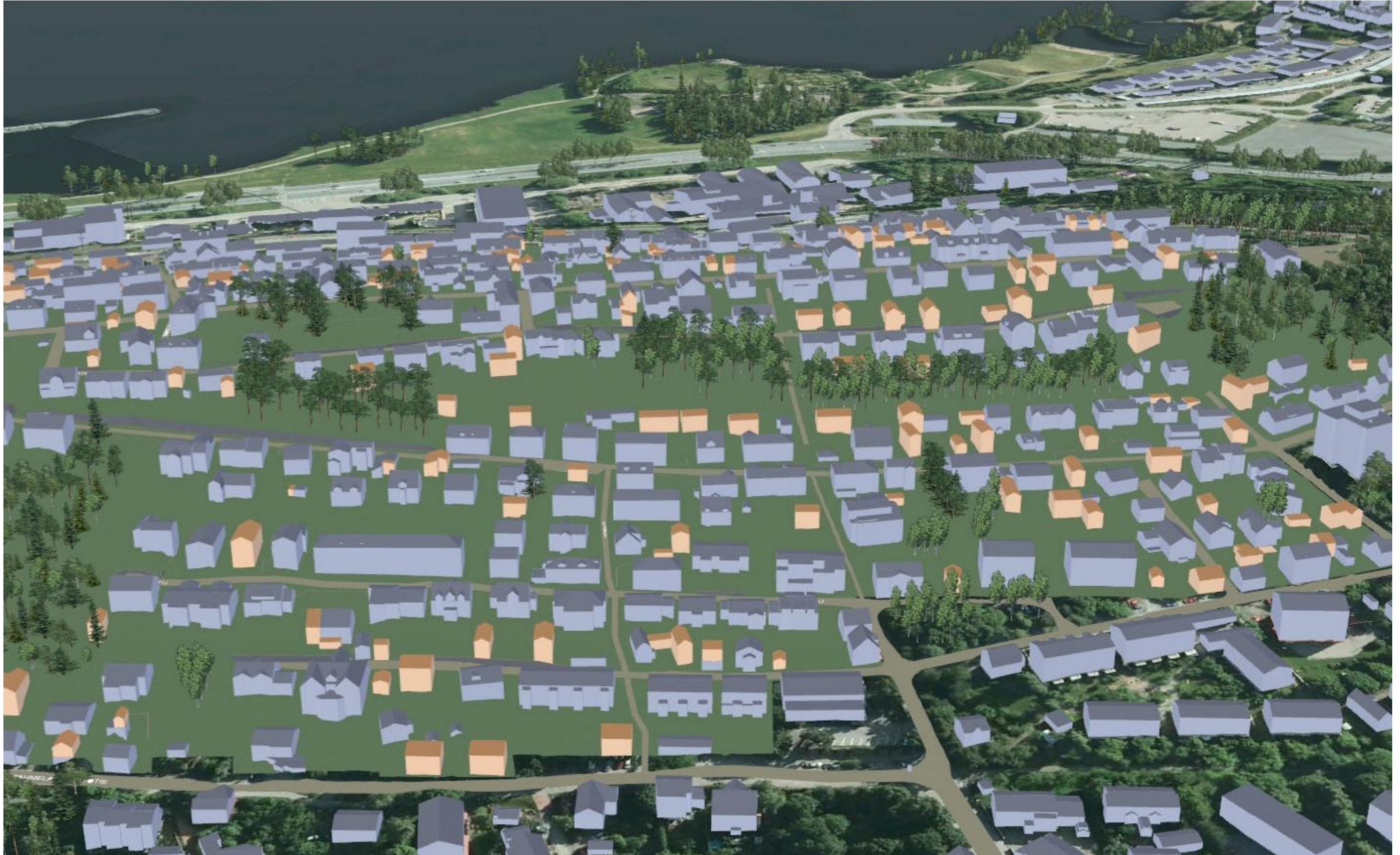
KUVA 5/6: ILMAKUVA ETELÄRINTEESTÄ

YLÄ-PISPALA, ASEMAKAAVAN MUUTOS, PISPALAN ASEMAKAAVAN UUDISTAMISEN I -VAIHE, KAAVAT 8256 JA 8257. LUONNOS. Tampereen kaupunki, Kaupunkiympäristön kehittäminen, maankäytön suunnittelu 20.2.2012.