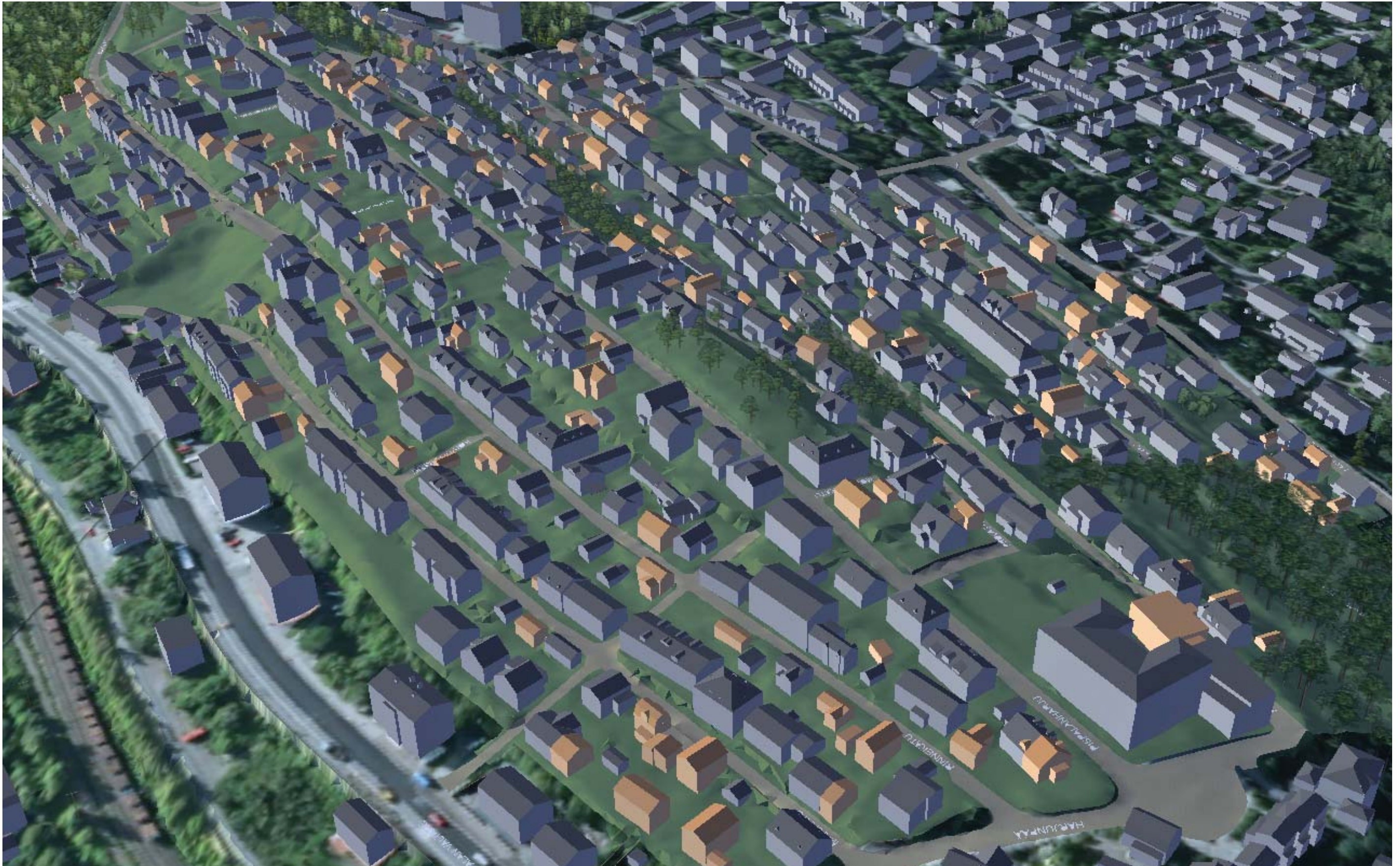
KUVA 3/6: ILMAKUVA LUOTEESTA

YLÄ-PISPALA, ASEMAKAAVAN MUUTOS, PISPALAN ASEMAKAAVAN UUDISTAMISEN I-VAIHE, ASEMAKAAVAT 8256 JA 8257. Tampereen kaupunki, Kaupunkiympäristön kehittäminen, maankäytön suunnittelu 20.4.2015