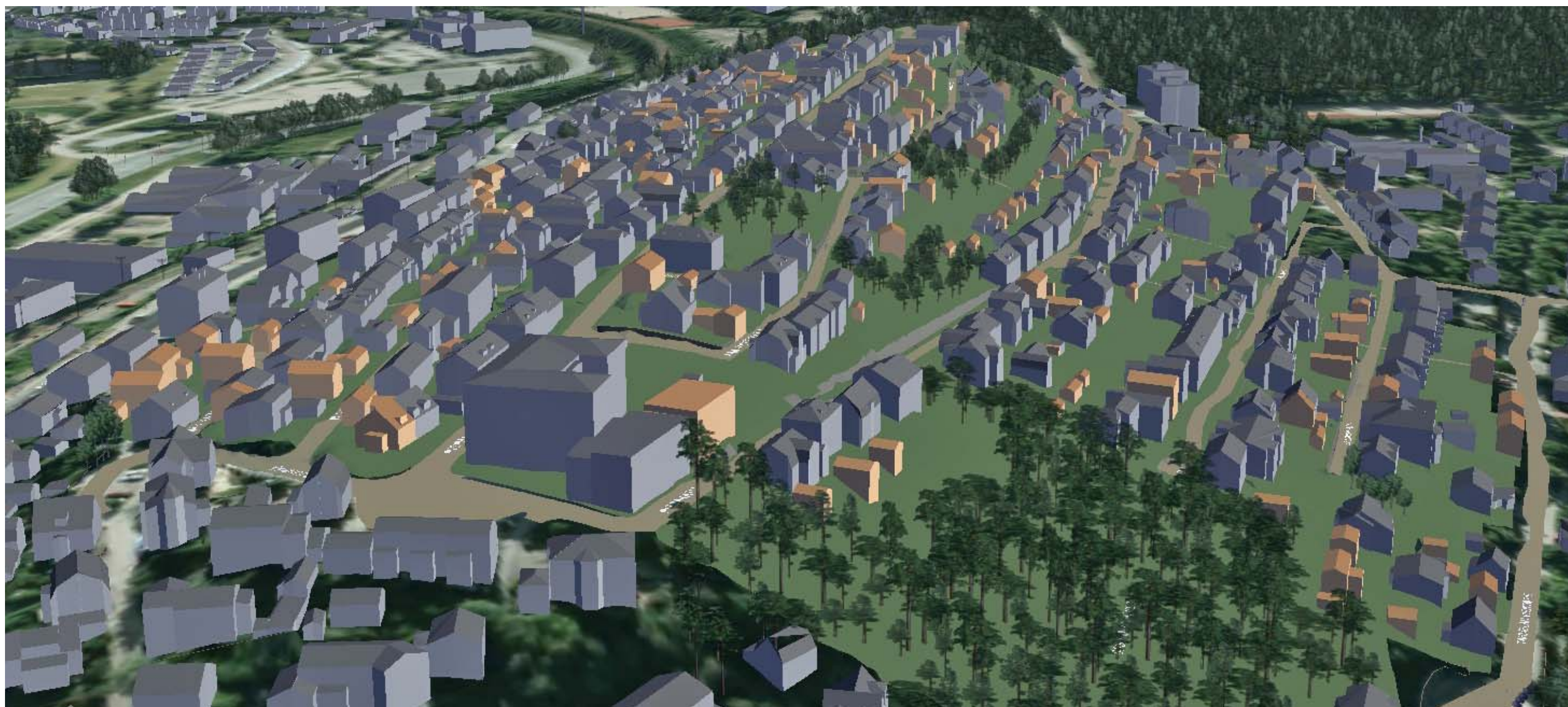
KUVA 4/6: ILMAKUVA LÄNNESTÄ

YLÄ-PISPALA, ASEMAKAAVAN MUUTOS, PISPALAN ASEMAKAAVAN UUDISTAMISEN I-VAIHE, ASEMAKAAVAT 8256 JA 8257. Tampereen kaupunki, Kaupunkiympäristön kehittäminen, maankäytön suunnittelu 20.4.2015