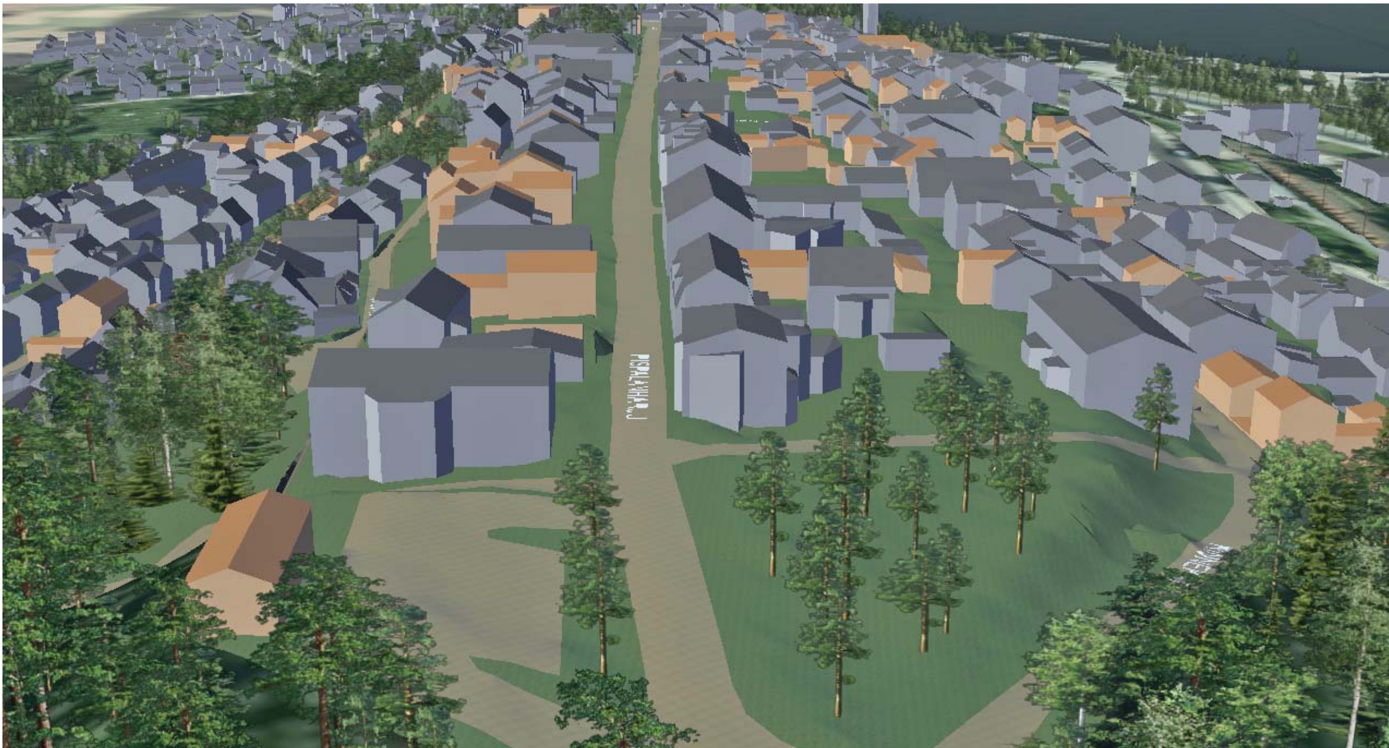
KUVA 1/6: ILMAKUVA PISPALAN PORTILTA LÄNTEEN