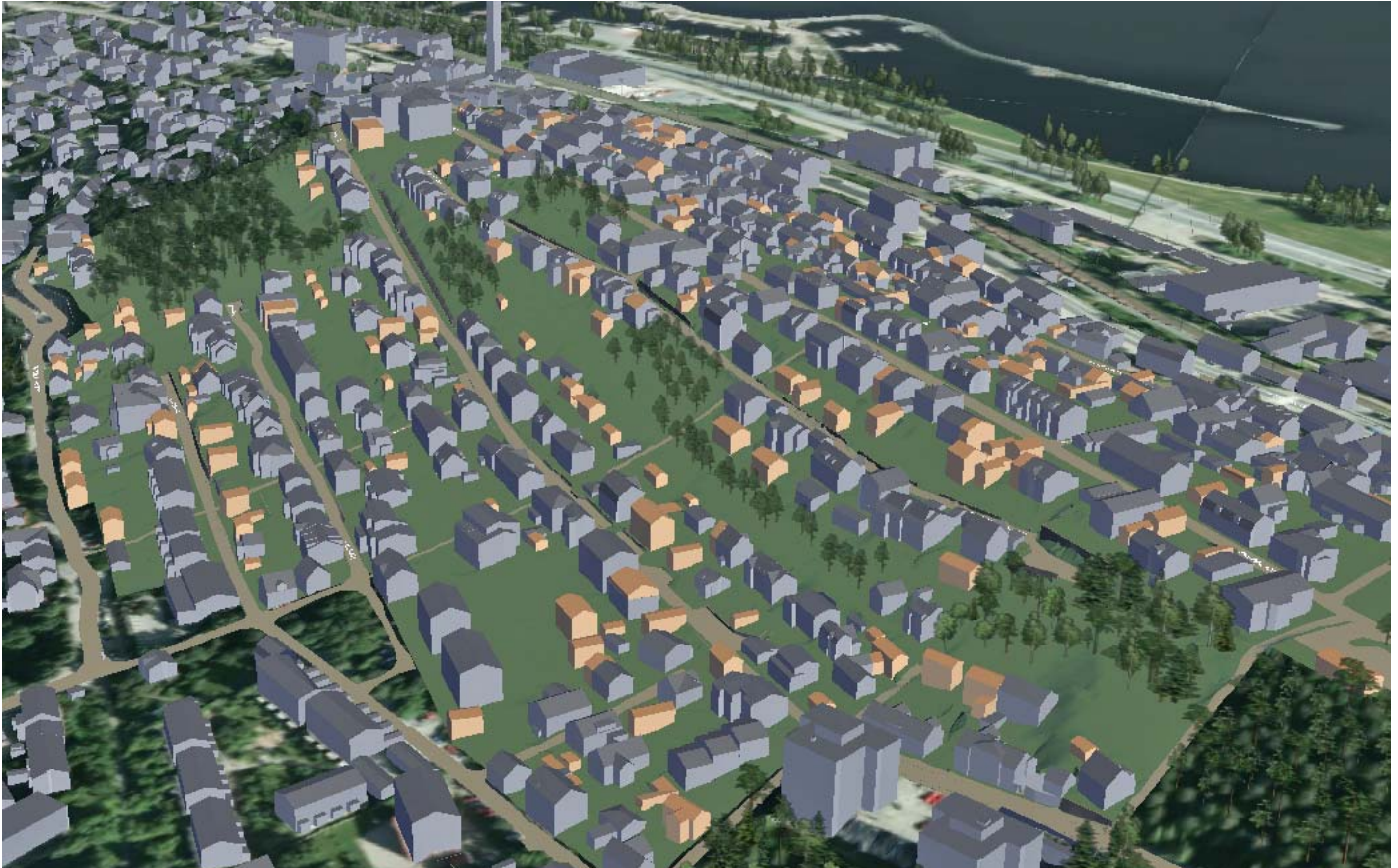
KUVA 6/6: ILMAKUVA KAAKOSTA

YLÄ-PISPALA, ASEMAKAAVAN MUUTOS, PISPALAN ASEMAKAAVAN UUDISTAMISEN I-VAIHE, ASEMAKAAVAT 8256 JA 8257. Tampereen kaupunki, Kaupunkiympäristön kehittäminen, maankäytön suunnittelu 20.4.2015