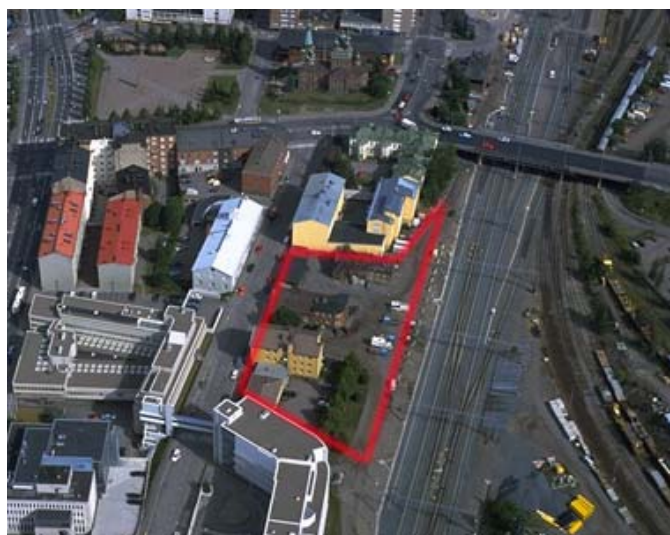
Ilmakuva kaava-alueesta v. 2003