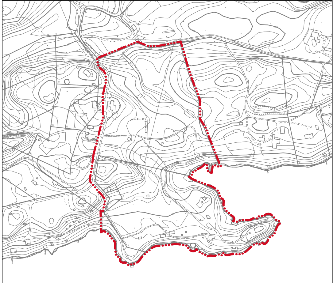
Kuva 1. Ranta-asemakaava-alueen rajausta pohjakartalla.

Kaavoitettavan alueen pinta-ala on n. 13,1 ha. Kaava-alueen rajausta on esitetty oheisessa kuvassa 1.