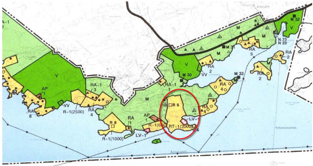
Kuva 4. Ote Aitolahti-Teisko Rantayleiskaavasta. Kaava-alueen sijainti punaisella.

Alueella on voimassa Ympäristöministeriön 28.2.1994 vahvistama Tampereen kaupungin Aitolahti-Teisko Rantayleiskaava . Siinä lähes koko kaavoitettava alue on osoitettu leirikeskusalueeksi, RT-1(3000). Suluissa oleva luku tarkoittaa alueen rakennusoikeutta. Pättinlahden rantaa on osoitettu venesatamaksi tai venevalkamaksi, LV-1. Kaava-alueita rajaa lännessä, pohjoisessa ja idässä maa- ja metsätalousvaltainen alue, M. Merkinnöillä "R 5" ja "R 6" on osoitettu kaksi merkittävää rakennusta, edellisen tarkoittaessa Aitolahden entistä pappilaa ja jälkimmäisen niemen kärjessä sijaitsevaa Pättinniemen huvilaa (ent. Björknäs).