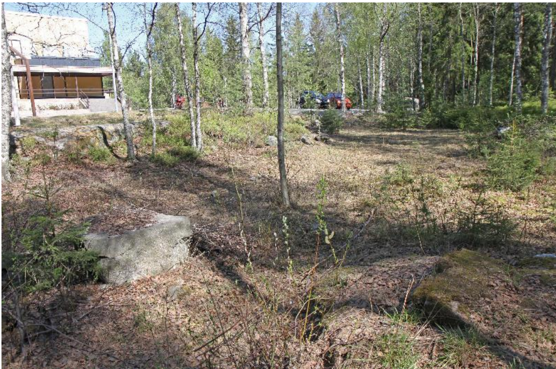
Kuva 2. Betonirakenne ja siihen liittyvä kivi koulun pihan eteläpuolella. Nähtynä lounaasta. 11.5.2011. (KYY 70: 2).