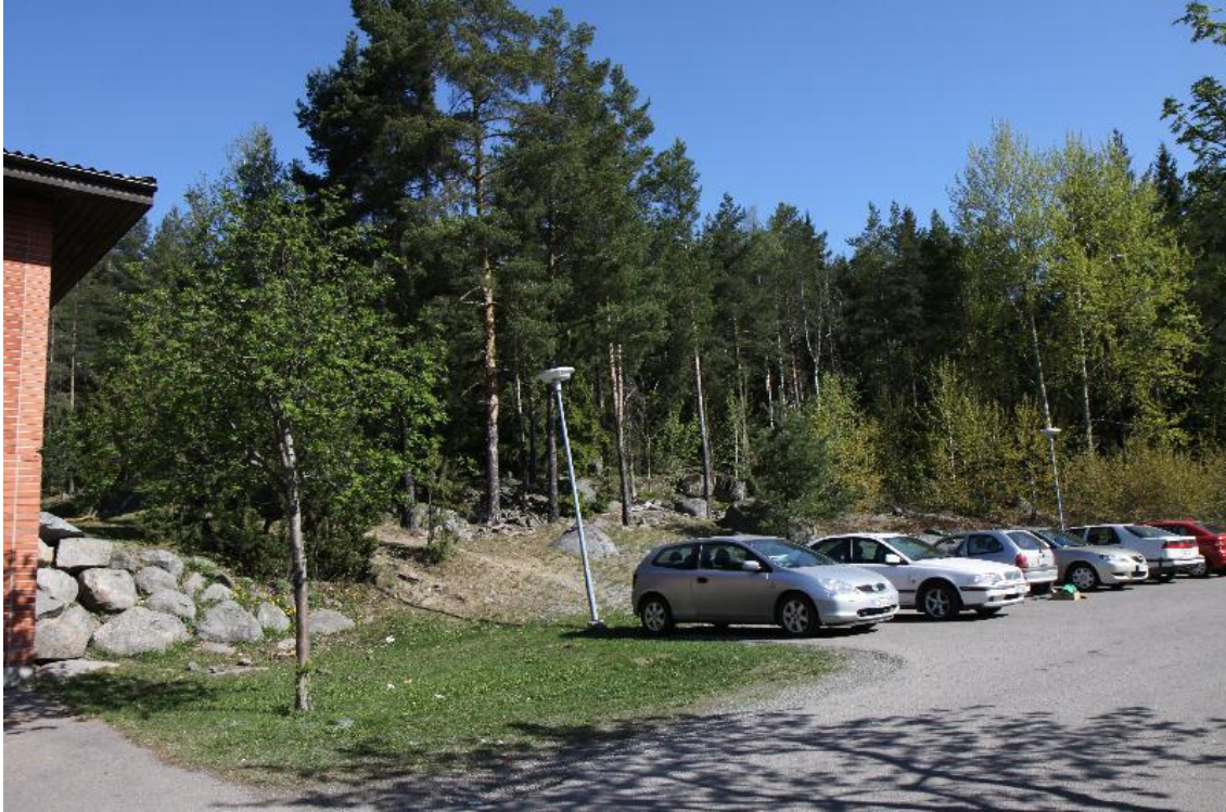
Kuva 1. Inventointialue Tesoman kirjaston parkkipaikalta nähtynä. (KYY 70: 1).