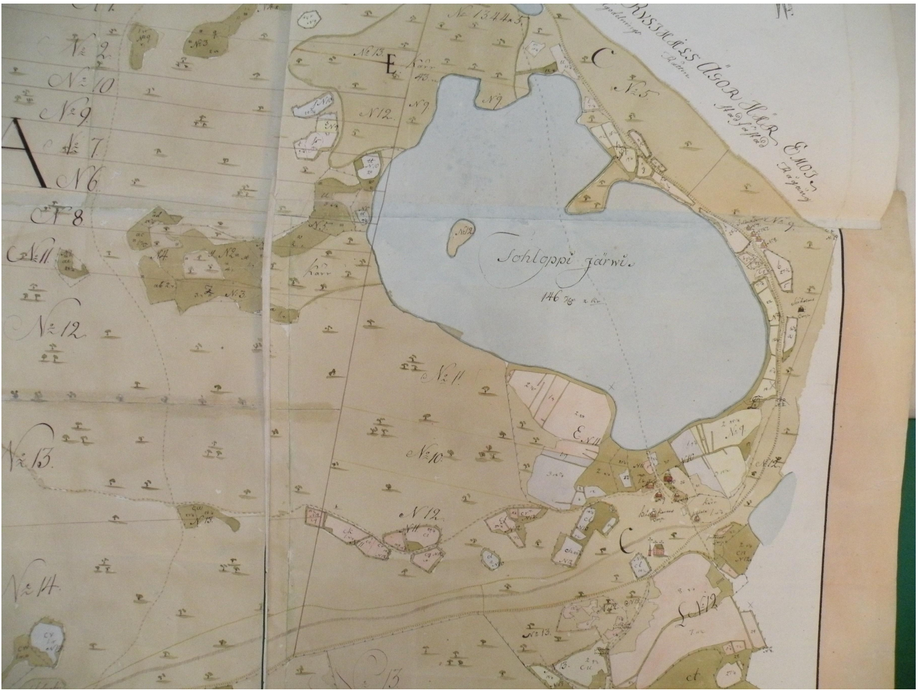
Kuva 5. Daniel Hallin isojakokartta (Sig. H 5 6/1-14) vuodelta 1767.