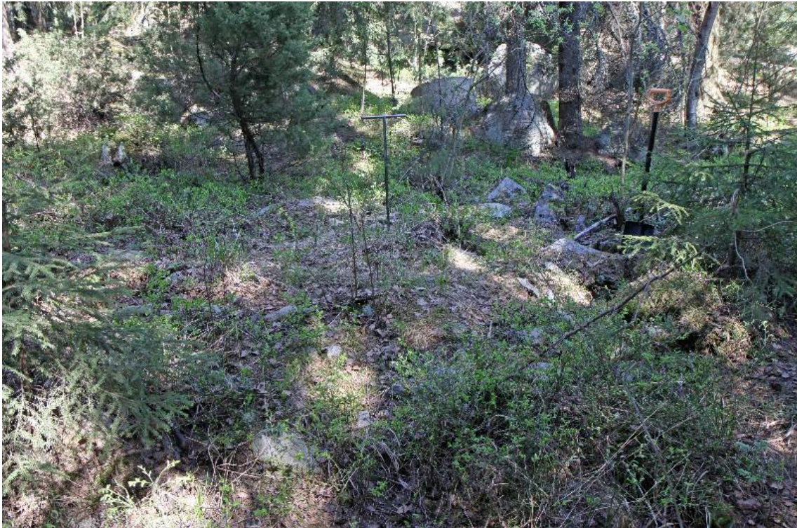
Kuva 2. Mahdollinen puhelinpylvään tai voimalinjapylvään paikka, löysä kivikko, metsikössä kirjaston luoteispuolella. T-piikki keskellä kivikkoa, lapio reunassa. Nähtynä luoteesta päin. (KYY 70: 3).