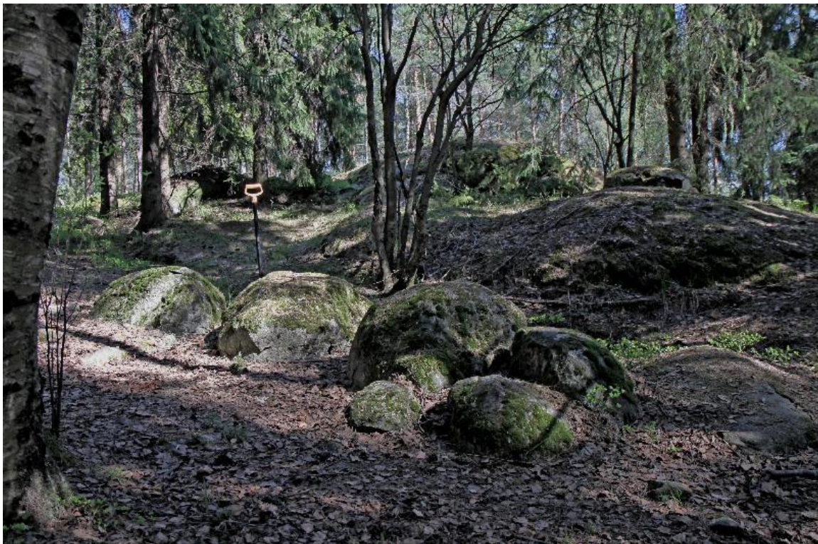
Kuva 4. Inventointialueen kivikkoista maastoa, suuria maakiviä kirjaston luoteispuolella. (KYY 70: 4).